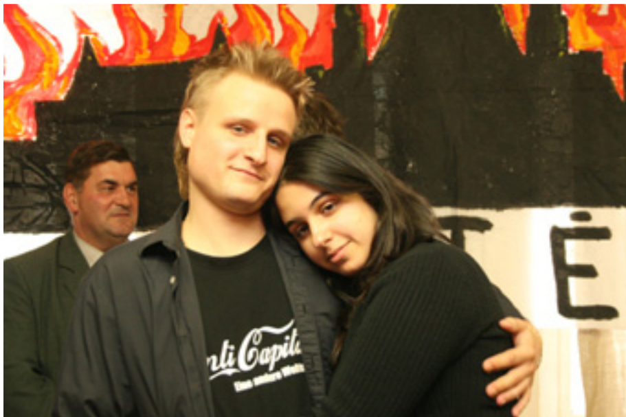
A PÁR, AKIK A BALOLDALI FRONTBAN TALÁLKOZTAK

A 2004-es Európai Parlamenti választásokon jelöltként indultam a Munkáspárt színeiben.