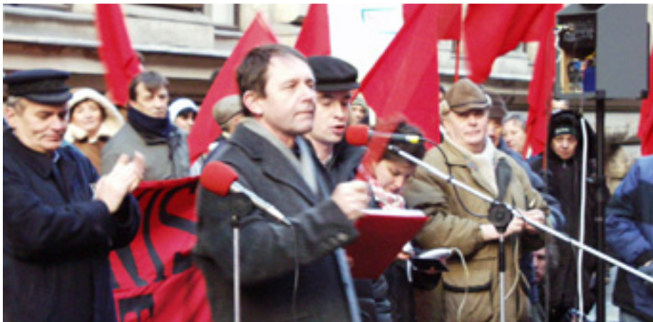
ZDENEK LEVY, CSEH- ÉS MORVAORSZÁG KOMMUNISTA PÁRTJA KÖZPONTI BIZOTTSÁGÁNAK TITKÁRA

Az alábbiakban részleteket olvashatnak a tüntetésen elhangzott beszédekből, felszólalásokból. A teljes szövegeket a Baloldali Front - Kommunista Ifjúsági Szövetség honlapján, a www.baloldali-front.hu oldalon olvashatják. ■