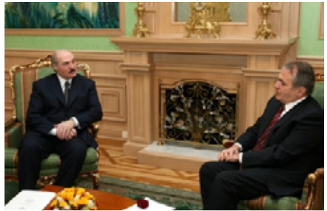
ALEKSZANDER LUKASENKO ÉS THÜRMER GYULA

Thürmer fehérorosz-országi látogatásának hivatalos, politikai része ezzel véget ért, a Magyar Kommunista Munkáspárt vezetője a nap folyamán még kulturális programokon vesz részt, amelyek