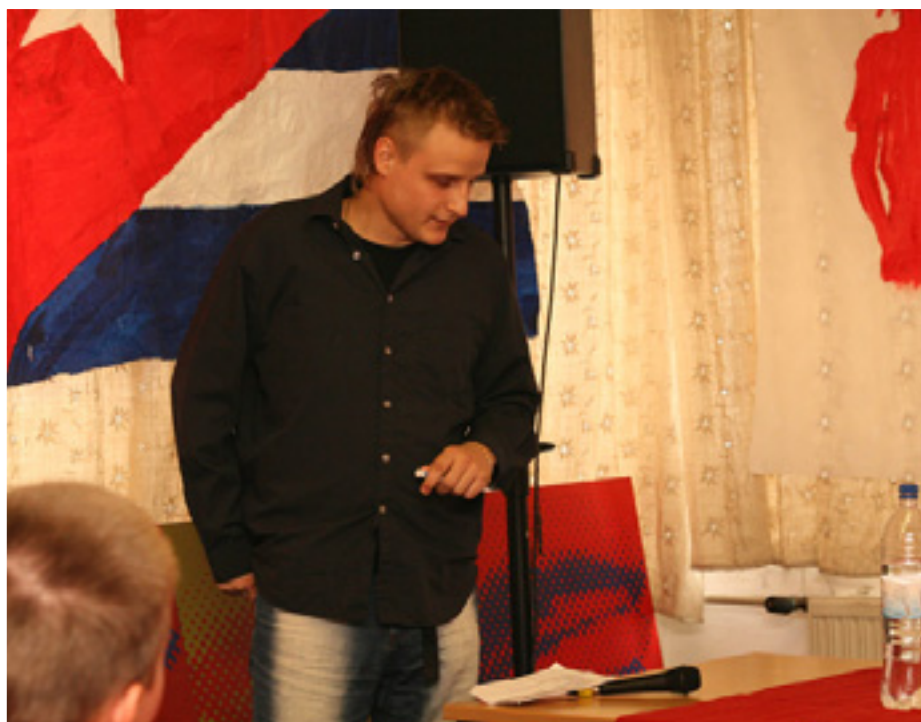
A BALOLDALI FRONT - KOMMUNISTA IFJÚSÁGI SZÖVETSÉG VIII. KONGRESSZUSÁN

A Munkáspártnak is tagja vagy. A pártban eddig milyen feladatokat láttál el?