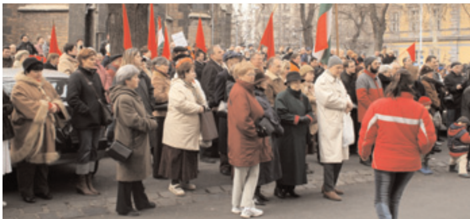
A MUNKÁSPÁRTI CSOPORT A TÜNTETÉSEN

"Elég volt! Magyarország nem kér a kormány liberális politikájából! Nem kérünk Gyurcsány úr "nem fog fájni" csomagjából! Nem kérünk a gázáremelésből, és a közlekedési díjak emeléséből sem! A Magyar Kommunista Munkáspárt felszólítja a kormányt, hogy azonnal hagyja abba az egészségügyi rendszer szétverését, kórházaink tönkretételét! Követeljük, hogy a GDP-nek legalább 8 %-át az egészségügyre fordítsák! Követeljük, hogy biztosítsák minden magyar ember számára, az egészséghez való egyetemes emberi jogot!"- olvasták sokan a munkáspárti követeléseket, és bizony, sokan egyetértően bólogtak. ■