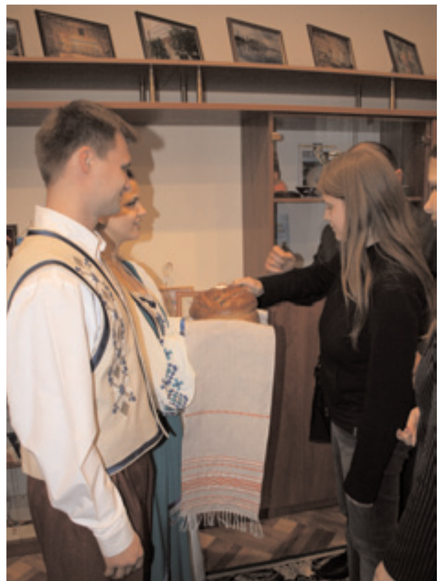
AZ ELSŐNAPI TALÁLKOZÓ, AHOL KENYÉRREL FOGADTÁK A DELEGÁCIÓT

csak 6 órában dolgozhat és különböző juttatásokat kap a fizetése mellé. Nyaranta minden diáknak egy rövid ideig el kell mennie dolgozni, ahol gyakorlatot szerezhethet és természetesen ezért fizetést is kap. Támogatják a fiatalok utazását, turizmusát. Jelenleg 54 egyetem van szerte az országban és számtalan alsóbb oktatási