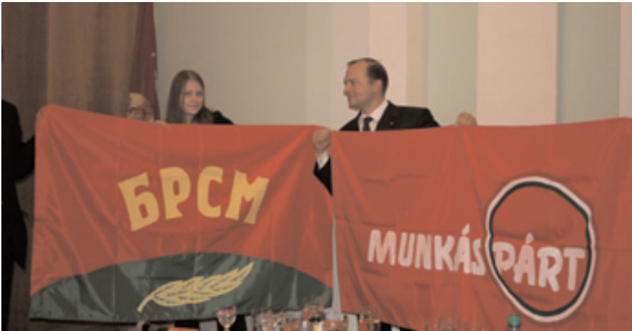
ÜNNEPÉLYES ZÁSZLÓATADÁS A KONGRESSZUS UTÁN

intézmény. Ennek ellenére folyamatosan építik az új iskolákat vidéken, hogy minden településnek saját intézménye lehessen, hogy a gyerekeknek, diákoknak ne kelljen utazni. A Baloldali Front - Kommunista Ifjúsági Szövetség kint tartózkodása során aláírt egy együttműködési szerződést a Belorusz Köztársasági Ifjúsági Unióval, ami az elkövetkezendő 5 évre szól, arról, hogy a két szervezet minden lehetséges úton segíti a másik munkáját, céljait, valamint a két ország fiataljai közötti kapcsolat létrejöttét.