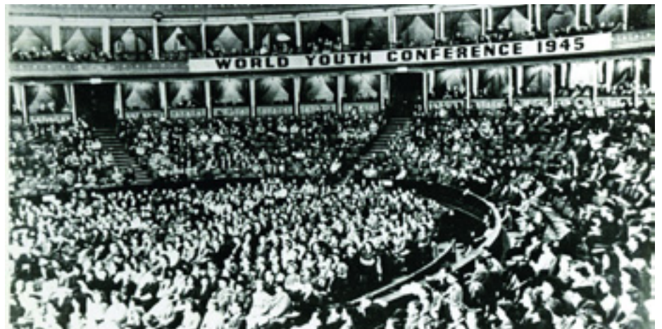
A DIVSZ MEGALKULÁSA 1945-BEN LONDONBAN

A Világifjúsági Tanácsot 1942 novemberében, Londonban alakították meg a fiatalok, azért hogy összefogja az ifjúságot, amíg győzelmet nem aratnak a fasizmus felett. A megalakuló konferencián 28 országból képviseltette magát az ifjúság. Ez volt az első lépés a nemzetközi ifjúsági egység felé. A szervezethez később számos ifjúsági szervezet csatlakozott, és sokan együttműködtek vele. Tagjai részt vettek a lerombolt területek újjáépítésében, gyógyszerek, kötszerek és más sebesültek részére szükséges eszközök beszerzésében, a kórházakban segédkeztek, és hadifoglyok fogadásában is központi szerepet játszottak. A Világifjúsági Tanács előzménye az a nagygyűlés volt, amit a szovjet ifjúság tartott Moszkvában 1941