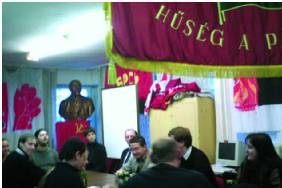
ÜLÉSEZIK A KONGRESSZUSI ELŐKÉSZÍTŐ BIZOTTSÁG

A Baloldali Front 2007. december 15-én megtartotta a Kongresszusi Előkészítő Bizottságának (KEB) az első ülését, mert a szervezet jövő év márciusában készül a következő, IX. kongresszusára.