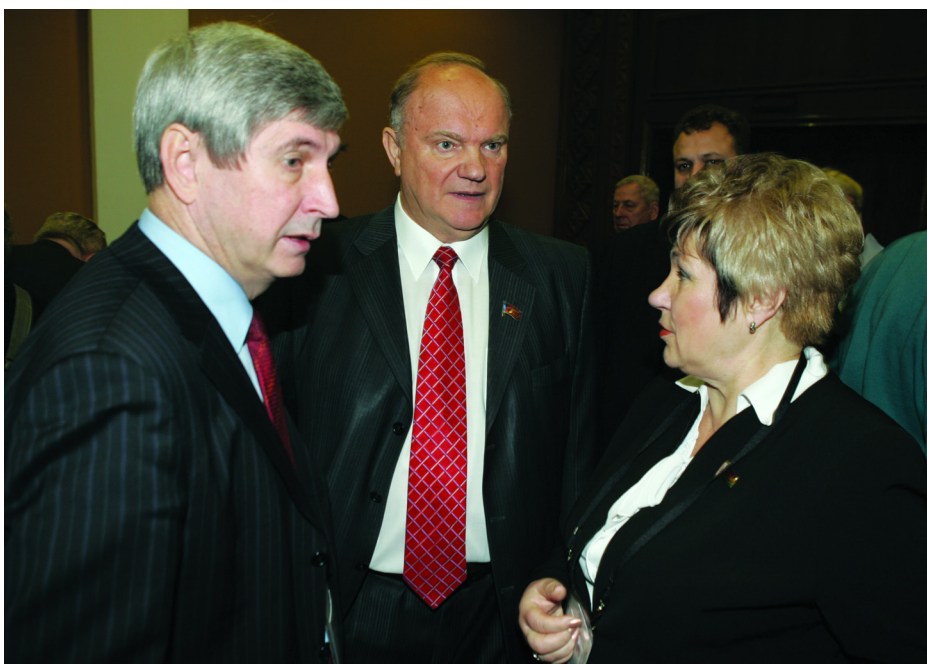
TATJANA GOLUBEVA AZ OROSZ KOMMUNISTA PÁRT VEZETŐIVEL

Belarusz Kommunista Pártjának kongresszusa az Egyesült Államok kormányához fordult, és követelte a belarusz belügyekbe való beavatkozás megszüntetését. „A nemzetközi imperializmus ideológusai igyekeznek elleplezni valós szándékaikat és látszólag baloldali pártokat hoznak létre, amelyek szép ígéretekkel tesznek az embereknek, virtuálisan harcolnak a szociális jólétért, a valóságban azonban külföldi pénzelőiknek azt ígérik, hogy liberális piaci reformokat hajtanak