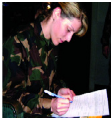
TOBORZÁS A RENDŐRSZAKSZERVEZETBE

A legeslegfontosabb következtetés: nem szabad csüggedni! Az osztályharc elkezdődött és folytatódik 2008-ban is!