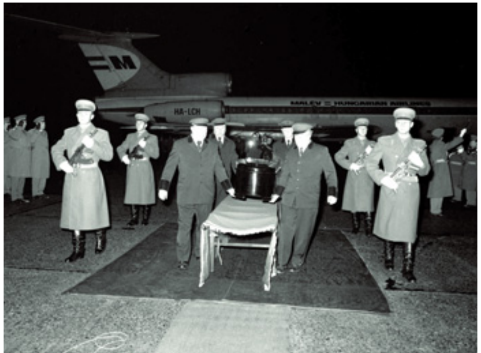
BUDAPEST, 1979. ÁPRILIS 6. BUDAPESTRE ÉRKEZETT AZ A REPÜLŐGÉP, AMELY ZALKA MÁTÉNAK, A SPANYOL POLGÁRHÁBORÚ LEGENDÁS HÍRŰ TÁBORNOKÁNAK HAMVAIT TARTALMAZÓ KOPORSÓT HOZTA HAZA ÁPRILIS 6-ÁN SPANYOLORSZÁGBÓL. A NEMZETKÖZI BRIGÁDOK HÍRNEVES LUKÁCS TÁBORNOKÁNAK FÖLDI MARADVÁNYAIT KATONAI TISZLELETADÁSSAL FOGADTÁK A FERIHEGYI REPÜLŐTÉREN

nagy szerepe van a moszkvai magyar íróemigráció tekintélyének kivívásában, ő teremtett kapcsolatot először a szovjet irodalom kiemelkedő képviselőivel: Szerafimovicssal, Lunacsarszkijjal (akit ő beszélt rá, hogy Petőfi Sándorral foglalkozzék), Gyemján Bednijel, Furmanovval (aki törökországi harcostársa volt).