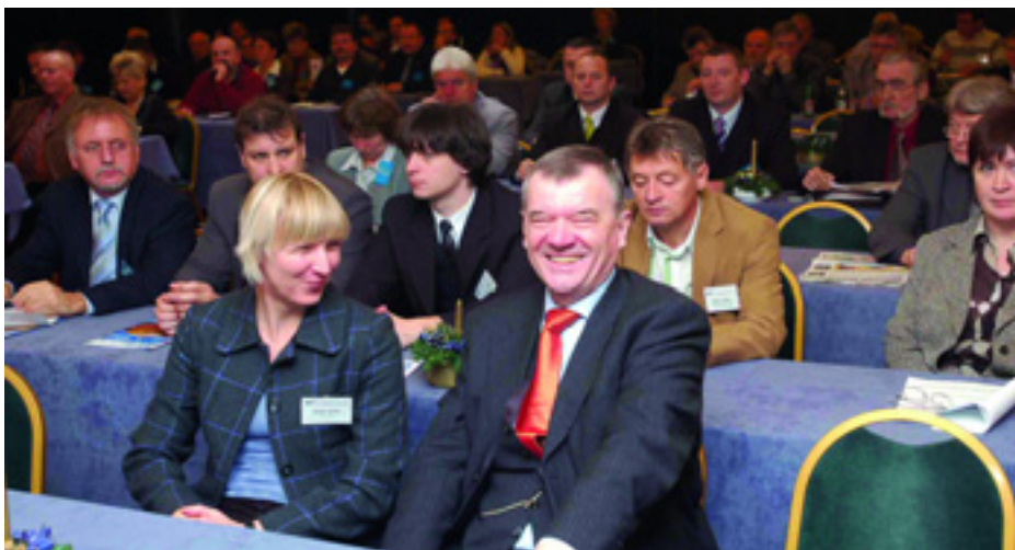
A LIGA SZAKSZERVEZETEK KONGRESSZUSÁNAK KÜLDÖTTEI

A LIGA Szakszervezetek és a Munkástanácsok az elmúlt hetekben szervezett valamennyi demonstrációt és sztrájkot sikeresnek értékeli: az akciók a társadalom többségének támogatásával zajlottak, számos civilszervezet csatlakozott a budapesti demonstrációkhoz, és december 17-én még több szakmai és ágazati szervezet részvételével, a korábbihoz képest jóval szélesebb körben zajlottak sztrájkok.