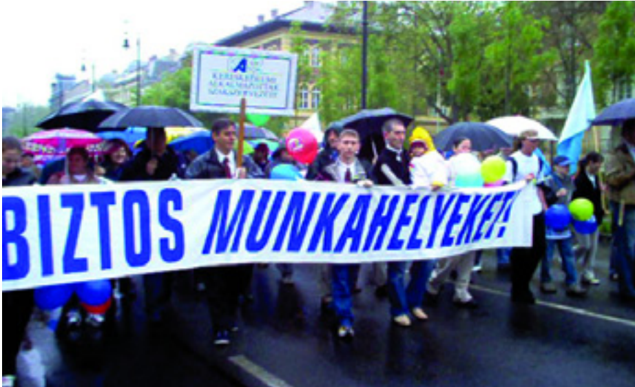
SZAKSZERVEZETI TŰNTETÉS 2007-BEN

A magyar dolgozók többet tanultak az elmúlt hetekben osztályharcból, mint bármikor az elmúlt évtizedekben. Vegyük sorra a tanulságokat!