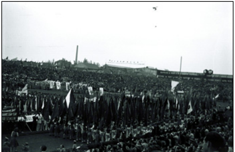
A VILÁGIFJÚSÁGI TALÁLKOZÓ MEGNYITÓJA AZ ÚJPESTI STADIONBAN - 1949

1949-ben Budapesten rendezték meg a VIT mellett a Demokratikus Ifjúsági Világszövetség II. kongresszusát is. ■