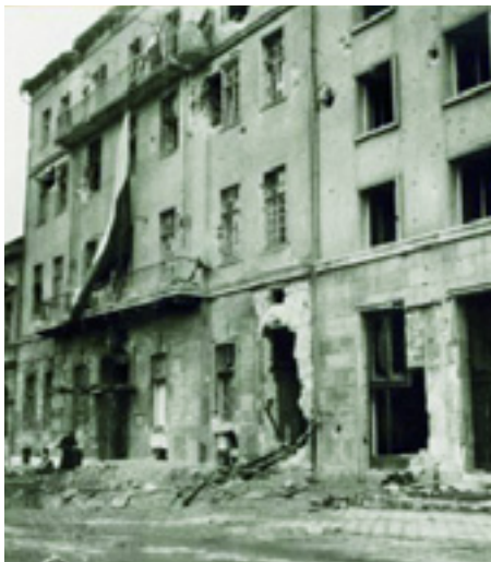
A KÖZTÁRSASÁGI TÉRI PÁRTHÁZ AZ OSTROM UTÁN

Szervezni járt Pest környékére, de legtöbbet és legszívesebben Felsőgallán dolgozott akkor, ahol szervezve tanította a bá-