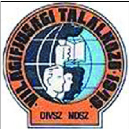
A BUDAPESTI VIT EMBLÉMÁJA

Két évvel a prágai Világifjúsági Találkozó után Magyarországon, Budapesten szervezték meg a második VIT-et 1949-ben. Szlogenje a „Fiatalkor egyesüljünk, előre a hosszan tartó békéért, demokráciáért, nemzeti függetlenségért és a népek jobb jövőéért” volt.