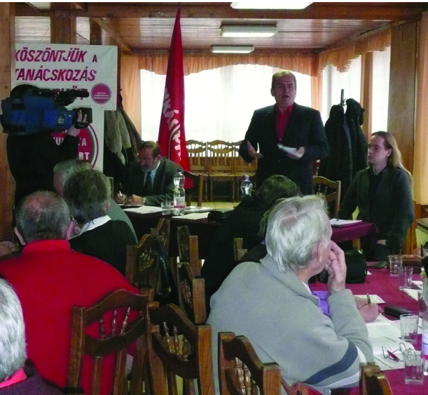
A SZOLNOKI KB-MEGBÍZOTTAK TANÁCSKOZÁSA

Legutóbbi számunkban láttuk, hogy a Központi Bizottság képviselőinek három feladatuk van. Ezek a feladatok egymáshoz kötődnek, egymásra épülnek.