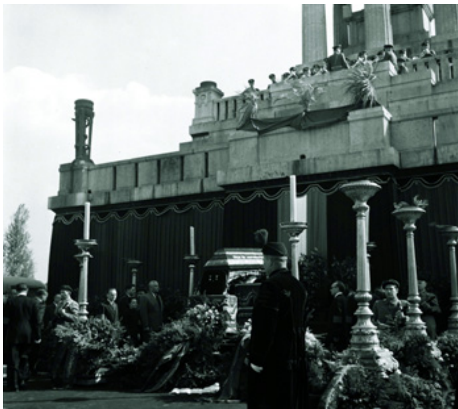
A MÁRTÍRHALÁLT HALT KÁLLAI ÉVA RAVATALA ÉS TEMETÉSE A KEREPESI TEMETŐBEN 1957. ÁPRILIS 18-ÁN

nyászifjúságot, és ismerkedett a számára új, jelentős proletárréteg életével. Három hétig volt vizsgálati fogságban az Andrássy-laktanyában. Napról napra próbára tették fizikai erejét, lelki ellenállóképességét. Ütötték-verték, eléje tárták mások terhelő vallomásait.