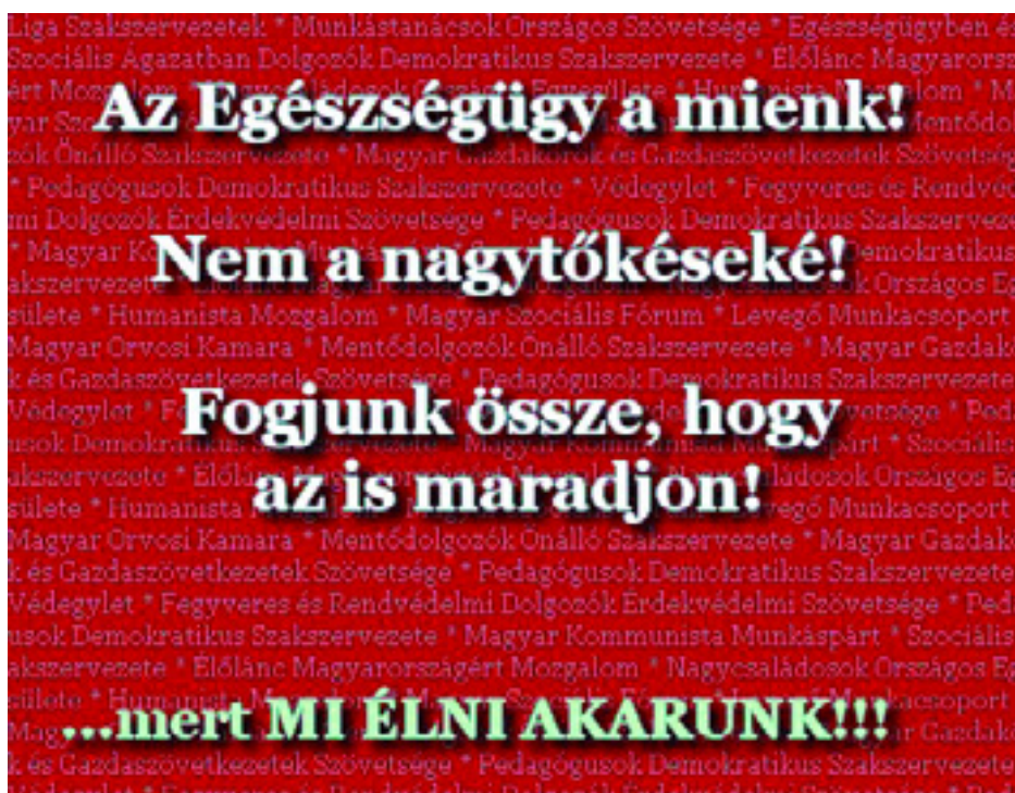
A HAJDÚ MEGYEIEK PLAKÁTJA AZ ALÁÍRÁSGYŰJTÉSI AKCIÓHOZ

A Munkáspárt helyi szervezetei országszerre megkezdtek a gyűjtést. A tapasztalat azt mutatja, hogy a gépezet kissé lassan indul be.