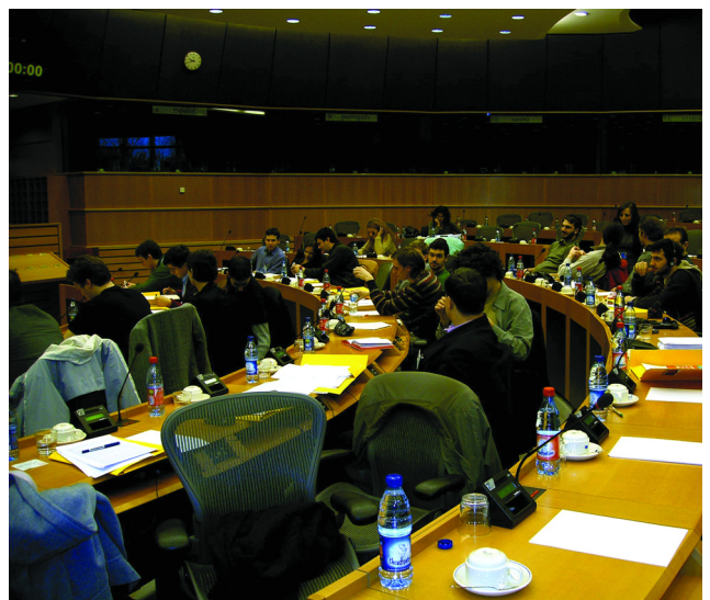
A BRÜSSZELI KONFERENCIA AZ EU SZÉKHÁZÁBAN

A konferencia lezárásaként egy zárónyilatkozatot fogadtak el a résztvevő szervezetek, ahol kihangsúlyozták annak fontosságát, hogy a jövőben együtt kell fellépniük az EU és a kormányok lépései ellen, közös akciókat, megmozdulásokat kell szervezni, hogy elérjük, hogy egész Európában ténylegesen ingyenes, mindenki számára elérhető, magas színvonalú oktatás legyen. ■