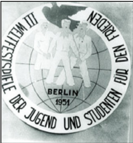
A BERLINI VIT EMBLÉMÁJA

1951-ben, Berlinben került sor a III. Világifjúsági Találkozó megszervezésére. Németország kettéosztása ekkor már befejeződött és a hidegháború elérte a csúcspontját.