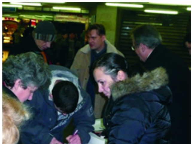
SOKAN ÖRÖMMEL ALÁÍRJÁK A KEZDEMÉNYEZÉST

Gyűjtünk tehát! Vigyük sikerre a népszavazás ügyét! ■