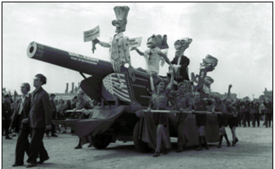
TILTAKOZÁS A VIT-EN AZ EGYESÜLT ÁLLAMOK FEGYVERKEZÉSI POLITIKÁJA ELLEN

Az előkészületei már 1948-ban megkezdődtek és 1949 áprilisában hívták össze az első Béke Világkonferenciát, egy időben Prágában és Párizsban. Itt hozták meg azt a döntést, hogy alakuljon meg a Béke Világtanács, ami pár hónappal később Varsóban létre is jött. Első kampányukban aláírásokat gyűjtöttek világszerte az atomfegyverek ellen. Harcolt a nukleáris fegyverek tesztelése ellen, és vezető szerepet játszott a vietnami háború megállításában. A 70-es években a neutronbomba ellen kampányoltak. A mai napig fontos szervezetnek számít, melynek több mint 100 békeszervezet a tagja a világon. Joliot Curie lett az első elnöke szervezetnek, aki korábban Nobel díjat nyert a mesterségesen előállított új radioaktív elemek felfedezéséért, később a német megszállás alatt részt vett a Nemzeti Front Bizottság megalakításában, amely a náci németek ellen folytatott partizán akciókat, később csatlakozott a Francia Kommunista Párthoz is. ■