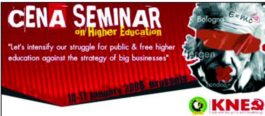
A KONFERENCIA PLAKÁTJA

Január 10-11-ig Brüsszelben a Görög Kommunista Párt segítségével az európai kommunista ifjúsági szervezetek két szemináriumot tartottak a felsőoktatásról "Erősítsük meg a harcot a nyilvános és ingyenes oktatásért, az üzleti stratégia ellen" jelszó alatt.