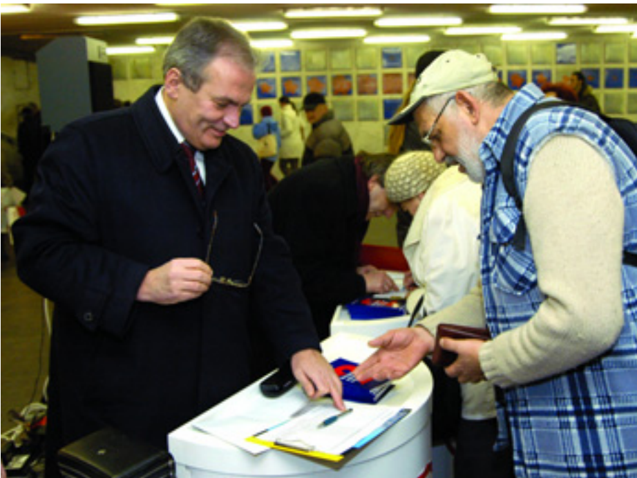
A BUDAPESTI ALÁÍRÁSGYŰJTÉSI KAMPÁNY KEZDETE A FERENCIEK TERÉN

A Munkáspárt is megkezdte a népszavazási aláírásgyűjtést az egészségbiztosítás kérdésében. Milyenek az első tapasztalatok?