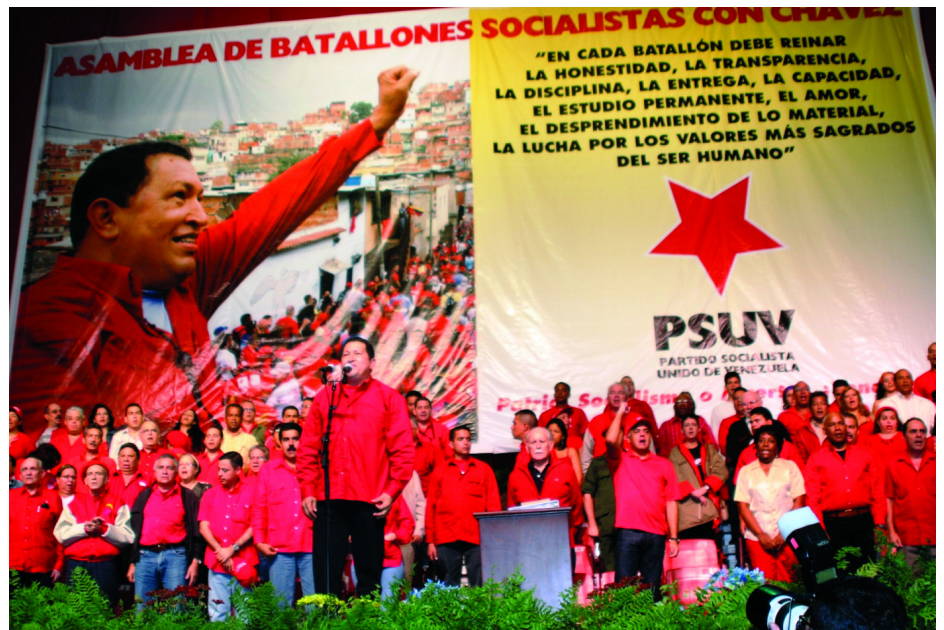
CHÁVEZ BESZÉDET MOND AZ EGYESÜLT SZOCIALISTA PÁRT ALAKULÓ KONGRESSZUSÁN

„A párttól függ a forradalom jövője.” - jelentette ki. A párt célja a dokumentum tervezetek szerint a „21. századi bolívari szocializmus felépítése”, az ország megvédése az