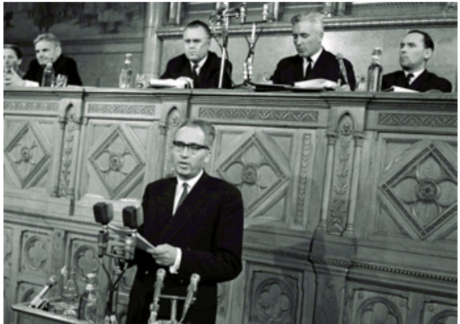
FEHÉR LAJOS FELSZÓLAL A PARTALMENTBEN A TERMELŐSZÖVETKEZETEK EGYKORI ORSZÁGOS KONGRESSZUSÁN

Az 1956-os ellenforradalom időszakában Kádár János mellé állt. 1956. október 23-án tagja lett az MDP KV Katonai Bizottságának. November 2-ától a Népszabadság főszerkesztő-helyettese, majd november 7-étől főszer-