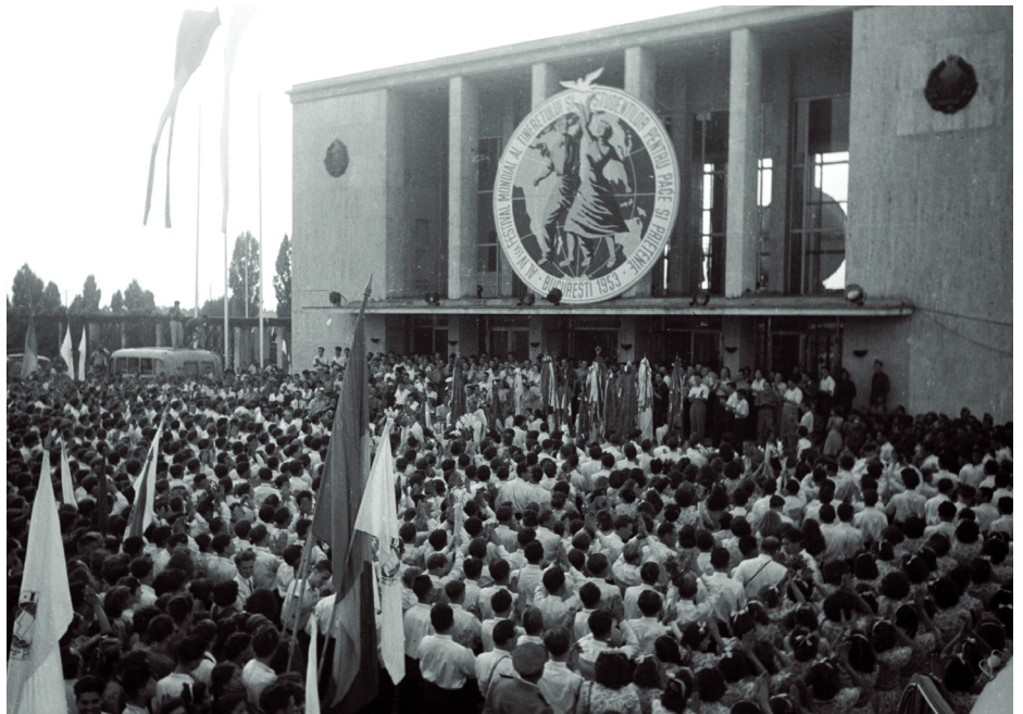
1953. AUGUSZTUS 2-ÁN TARTOTTÁK A IV. VILÁGIFJÚSÁGI TALÁLKOZÓ MEGNYITÓ ÜNNEPSÉGÉT AZ BUKARESTI AUGUSZTUS 23. STADIONBAN

A bukaresti VIT-nek az volt még a különlegessége, hogy a Német Demokratikus