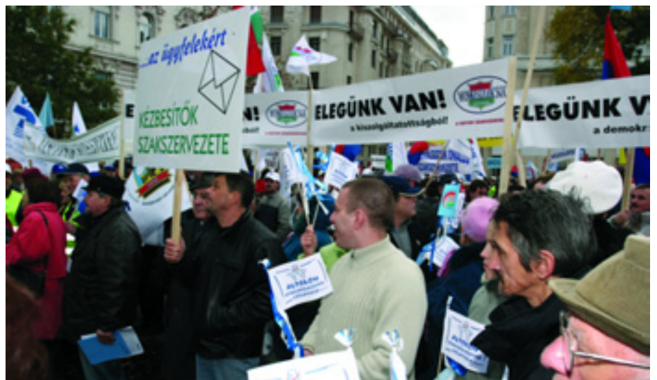
A MUNKÁSTANÁCSOK TAGJAI A KÖZÖS NOVEMBERI SZAKSZERVEZETI TÜNTETÉSEEN

a nemzeti vagyon további kiárusítása ellen. Az Alkotmánybíróságon megtámadták azokat a kormány által hozott intézkedéseket, melyek a lakosságot hátrányosan érintették, valamint törvénymódosítási javaslatokat fogalmaztak meg a munkavállalók védelme érdekében. ■