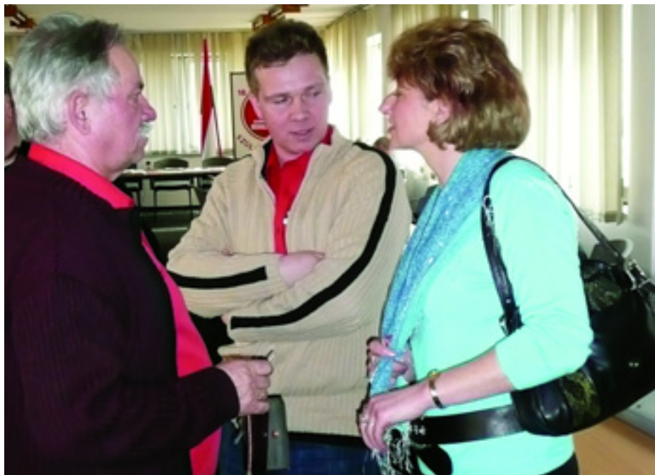
PÁRTTAGOK ÉS SZIMPATIZÁNSOK A KB-ÜLÉS SZÜNETÉBEN