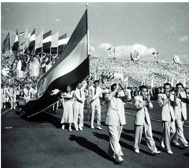
MAGYAR FIATALOK FELVONULÁSA A VARSÓI VIT-EN

A Demokratikus Ifjúsági Világszövetség 1955-ben csatlakozott a bandungi érkezőlet felhívásához, és április 24-ét a gyarmatosítás, az újragyarmatosítás ellen küzdő fiatalok napjává nyilvánította.