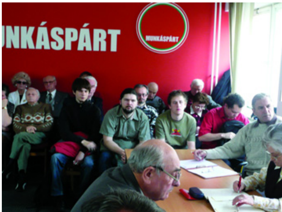
KB-MEGBÍZOTTAK, ÉRDEKLŐDŐ AKTIVISTÁK ÉS A BALOLDALI FRONT TAGJAI A KÖZPONTI BIZOTTSÁGI ÜLÉSEN

A válaszunk IGEN, mert számunkra nem az a kérdés, hogy mely politikai erők kezdeményezték, hanem az, hogy jó ügyet