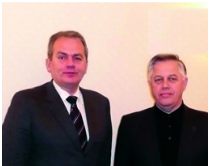
THÜRMER GYULA ÉS PJOTR SZIMONYENKO

Megállapodtak, hogy a jövőben is együttműködnek nemzetközi fórumokon. Mindent megtesznek azért, hogy revizionista pártok semmilyen formában ne kapcsolódhassanak a kommunista és munkáspártok rendszeres intézményes együttműködéséhez. A két pártvezető véleményt cserélt arról, hogy miként lehetne kialakítani Szabolcs-Szatmár-Bereg és Kárpátalja pártszervezetei között együttműködést. ■