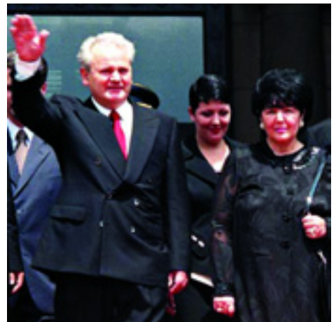
MILOSEVIC ELNÖK ÉS FELESÉGE, MIRA ASSZONY

1995-ben járt Magyarországon a Munkáspárt meghívására. Méltóságteljesen védte hazája érdekeit a magyar politika támadásaival szemben, amely már akkor mindent megtett a jugoszláv rendszer megdöntéséért, olyan új politikusi garnitúra hatalomra juttatásáért, amely kiszolgálja a nyugati tőkés világ érdekeit.