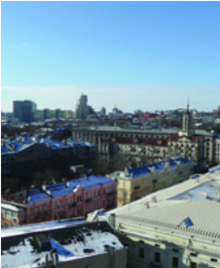
A KIJEVI FŐVÁROS LÁTKÉPE

Ukrajna minden sajátossága mellett tőkés ország. A meghatározó politikai erők, a kommunistákat leszámítva, így vagy úgy a tőke valamelyik csoportjához kötődnek.