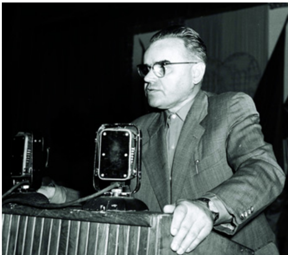
II. ORSZÁGOS BIZALMI TALÁLKOZÓ, AMELYEN A SZAKSZERVEZETI BIZALMIÁK TÖBB MINT 1000 KÜLDÖTTE JELENT MEG. KISS KÁROLY, A MAGYAR SZOCIALISTA MUNKÁSPÁRT KÖZPONTI BIZOTTSÁGÁNAK TITKÁRA BESZÉL 1957. AUGUSZTUSÁBAN

helyezkedett el egy cipőgyárban. 1941-ben hamis névhasználatért egy hónapi fegyházra ítélték, majd internálták, 1943 nyarán szabadult. Ismét bevonták a párt központi bizottságába. Részt vett ellenállási sejtek szervezésében. A német megszállás után ismét internálták, 1944 szeptemberében szabadult.