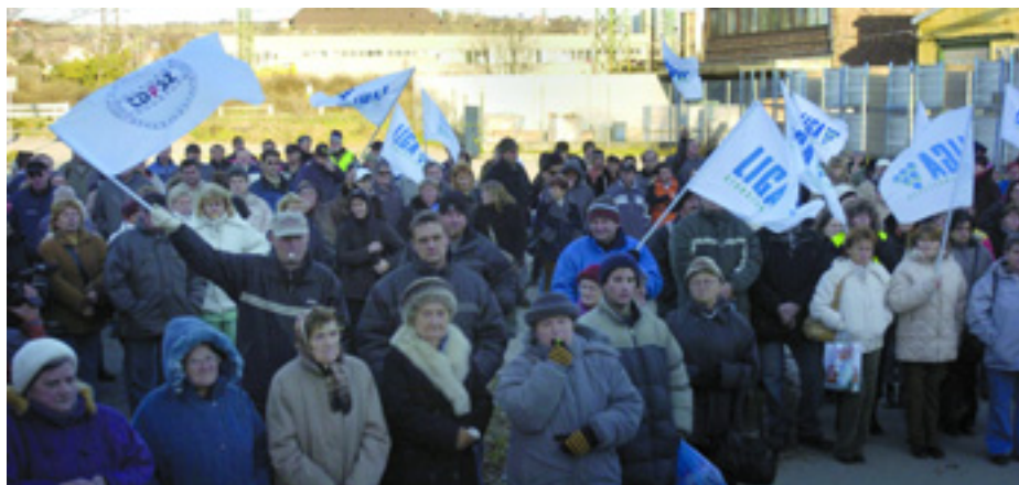
TÜNTETÉS A GENERAL ELEKTRIC VÁCI ÜZEME ELŐTT AZ ELBOCSÁTÁSOK ELLEN

Az ígéretet, az új modern gyártósorok ígéretet maradtak. Hoztak ugyan új gyártósorokat a bezárt angliai üzemből, de a több mint harmincéves korú gépeket jóindulattal még újszerűnek sem lehetett nevezni. Ezeket a le-