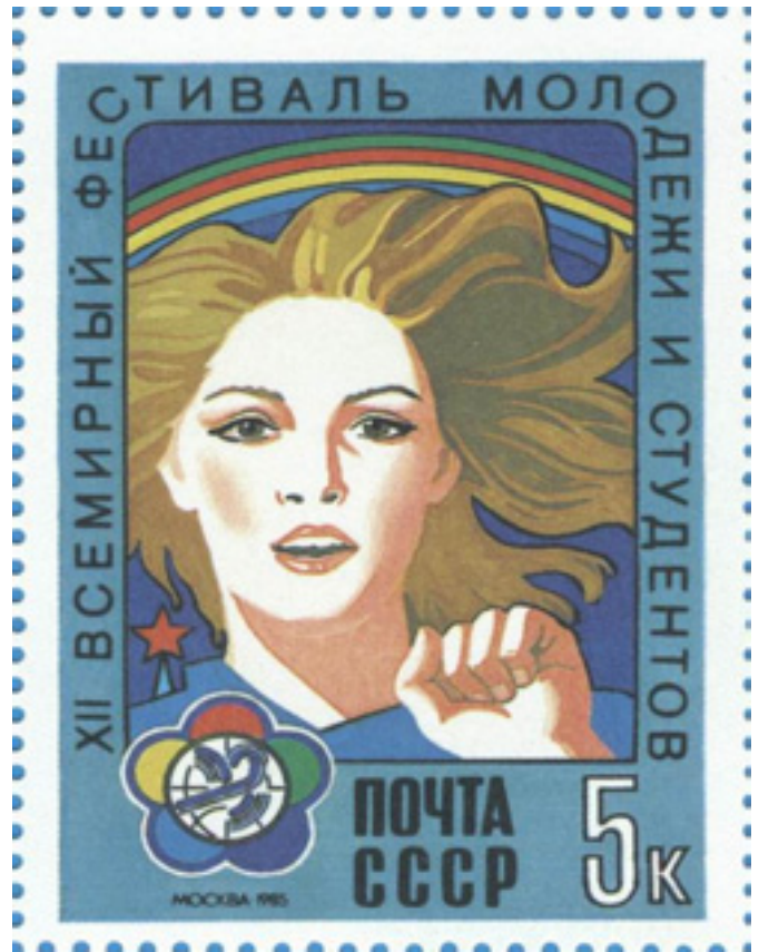
AZ 1957-ES MOSZKVAI VILÁGIFJÚSÁGI TALÁLKOZÓRA KIADOTT BÉLYEG

A kedvező helyzet megérlelte annak lehetőségét, hogy a VIT-mozgalom egy jelentős lépést tegyen.