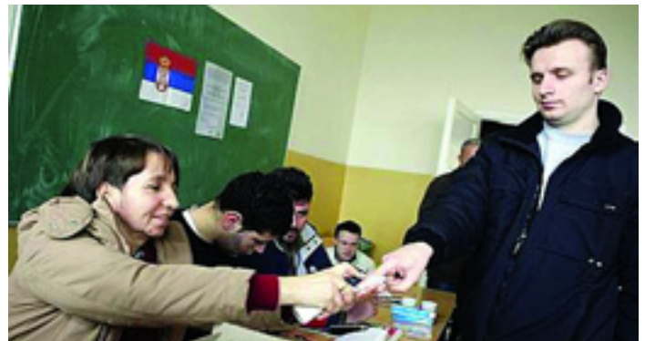
MI LESZ VELED SZERBIA? EGY BELGRÁDI VÁLASZTÁSI HELYSÉG

A NATO központjában azonban úgy érzik, ők ellenőrizni tudják, hogy "meddig ég a kanóc", mi több ezzel zsarolhatják, és sakkban tarthatják a balkáni országokat.