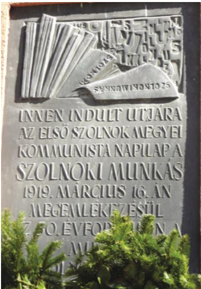
A RENDSZERVÁLTÁST TÚLÉLT 1919-ES EMLÉKTÁBLA SZOLNOK VÁROSÁBAN

A szolnoki kommunisták olyan emléktáblára találtak a városukban, amely a magyar munkásmozgalomhoz, a Tanácsköztársasághoz kötődik, és valahogyan túlélte az elmúlt két évtizedet is. A szolnoki városházával szemben áll az az épület, ahol 1919 március 16-án útjára indult a Szolnoki Munkás, az első szolnoki kommunista lap. „Vállalható és védendő örökségünk!” – döntöttek a helyi szervezet tagjai. A Munkáspárt városi szervezete a Tanácsköztársaság ünnepén megkoszorúzta az emléktáblát, és mostantól évről-évre itt emlékeznek az első magyar munkásállamra. Az országban bizonyára akadnak még elfeledett emléktáblák, emlékhelyek. Fedezzük fel múltunkat!