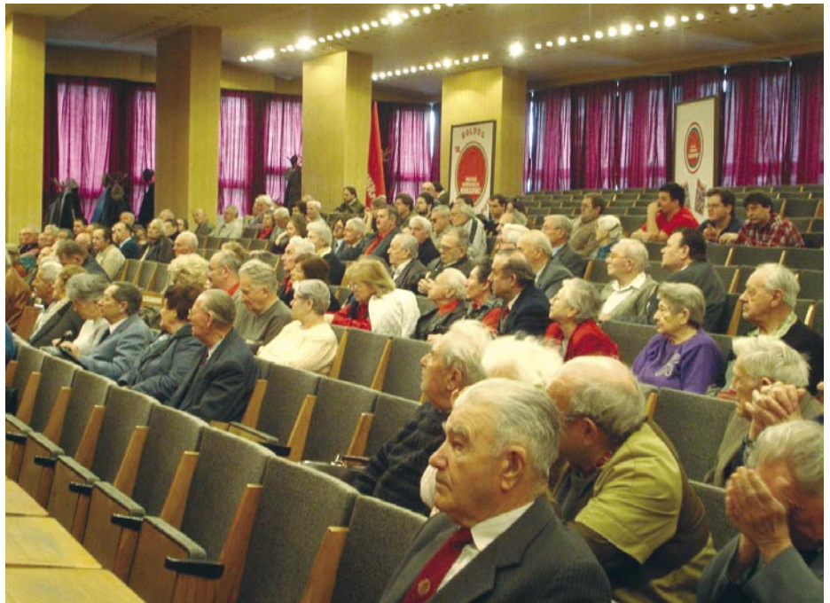
A PÁRTÉRTEKEZLET PONTOSABB ÉS JOBB MUNKÁT KÖVETELT

Nem sikerült megszervezni a tényleges pártoktatást, s a KB-megbízottak többsége sem kapcsolódott be hatékonyan választóközre életébe. „A Nagy-Budapesti Elnökség elit csapatát jelenthetik a KB-képviselők. Ma azonban ettől messze vagyunk. A KB-képviselők többsége nem érti a feladatát, és semmit sem csinál. Az elnökség feladata, hogy mindenkivel kü-