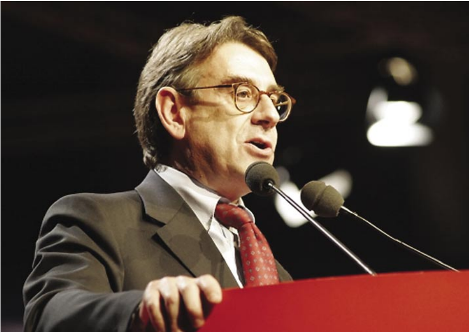
OLIVIERO DILIBERTO MÁR A VÁLASZTÁSOK ELŐTT FIGYELMEZTETT

Húsz év alatt másodszor vár újjáalakításra az olasz kommunista mozgalom. Az 1970-es években megváltozott a párt szociális összetétele.