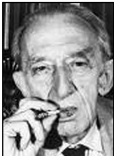
RÉSZLETEK LUKÁCS GYÖRGY TANULMÁNYÁBÓL

A proletariátus osztályharca lényege szerint a polgári társadalom tagadása. Ez semmiképpen sem jelenti a Marx által joggal kigúnyolt politikai közömbösséget az állammal szemben. Éppen ellenkezőleg: olyan harcmódot jelent, amelyben a proletariátust egyáltalában nem kötik a polgári társadalom által, saját céljai megvalósítása érdekében kiépített formák és eszközök, amelyben a kezdeményező fél minden esetben a proletariátus. Figyelembe kell vennünk azonban, hogy a proletár osztályharcnak ez az egészen tiszta formája csak nagyon ritkán bontakozhat ki. Bár a proletariátus történetfilozófiai küldetése alapján állandó harcot folytat a polgári társadalom létezése ellen, adott történelmi helyzetekben nagyon gyakran defenzívába kényszerül a burzsoáziával szemben.