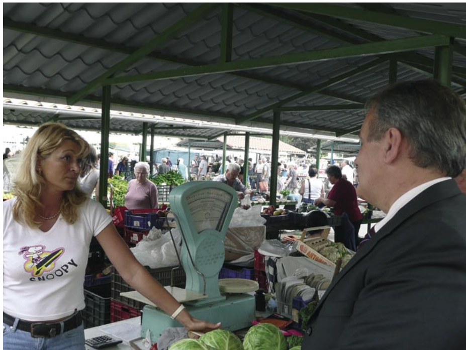
„TANÁRNŐ VAGYOK, DE MOST ZÖLDSÉGET ÁRULOK, MERT MÁSKÉNT NEM TUDUNK MEGÉLNI”