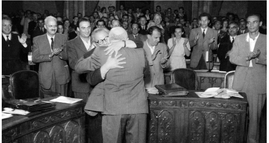
A PÁRTEGYESÜLÉS ÜNNEPI PILLANATAI

A nemzetközi munkásmozgalom két alapvető irányzata, a kommunista és szociáldemokrata vonal kialakulása az 1900-as évek elején az ideológiai szakadással kezdődött, amelyet politikai, majd szervezeti elkülönülés követett. A szakadás folyamata elsőként az Oroszországi Szociáldemokrata Munkáspártban zajlott le a kommunista bolsevik és a szociáldemokrata mensevik irányzat kialakulásával. Ez a korai szétválás nagyban erősítette a bolsevik pártot, és