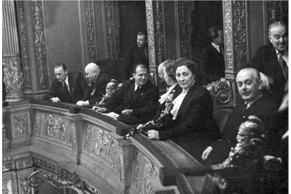
A PÁRTEGYESÜLÉS UTÁNI ÜNNEPI KONCERTEN. KÜLSŐSÉGBŐL SOK VOLT.

A pártegyesülés alapvető társadalmi osztályai – a munkásosztály és a parasztság – sem mutat egységes képet. A felszabadulás után nem múlt el nyomtalanul a Horthy-korszak 25 éve. A társadalom széles rétegeiben erősen jelen van az antikommunizmus és a szovjet-ellenesség. A lakosság 60 százalékát adó