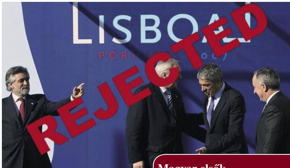
VISSZAUTASÍTVÁ. AZ UNIÓ URAI EZÚTTAL VESZÍTETTEK A LAKOSSÁGGAL SZEMBEN

Mindezt soha sem bocsátották nyílt vitára. Az elképzelés elődje, az európai alkotmány 2005-ben megbukott Hollandiában és Franciaországban is.