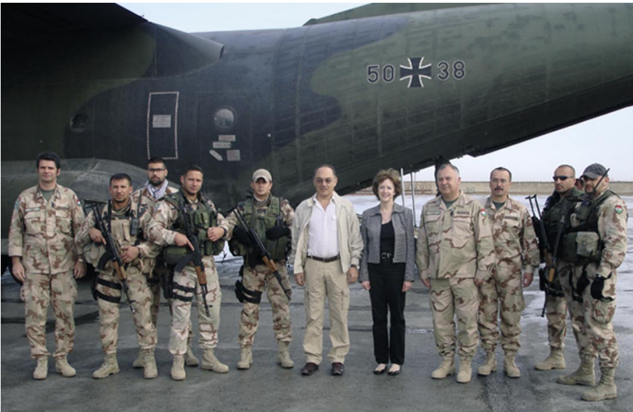
SZEKERES IMRE AFGANISZTÁNBAN. NÉMET GÉP, MAGYAR KATONA, MILYEN ÉRDEK?

A múlt héten Afganisztánban elesett egy magyar katona. A fiatalember zsoldos volt, tudta mit és mennyiért vállal. Azt nem tudta, hogy társaival együtt ő egy egyszerű üzlet része: Gyurcsányék vérrel fizetnek dollárok és eurók helyett.