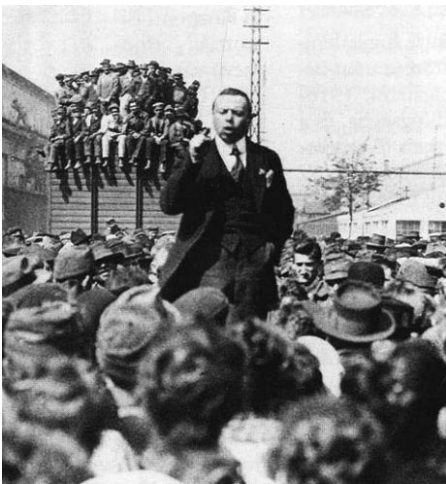
KUN BÉLA BESZÉL 1919-BEN

November 24-én lesz 90 éve annak, hogy megalakult elődünk, a Kommunista Magyarországi Pártja. Hogyan, milyen eszközökkel küzdöttek elődeink?