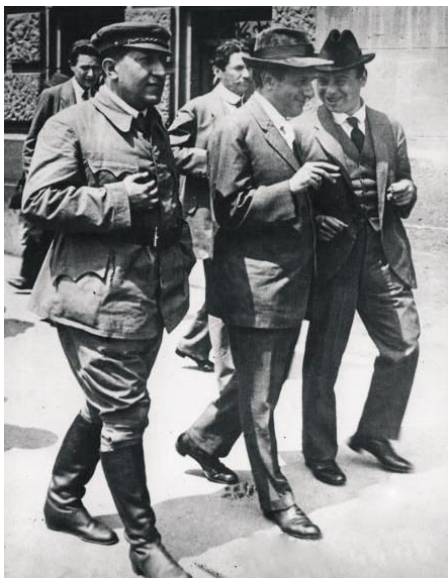
A KOMMUNISTA POGÁNY JÓZSEF ÉS KUN BÉLA KÖZÖTT A SZOCDEM KUNFI ZSIGMOND

November 24-én lesz 90 éve annak, hogy megalakult elődünk, a Kommunista Magyarországi Pártja. Az új pártnak a polgári pártok mellett mindenek előtt a szociáldemokráciával kellett élet-halál harcot vívnia.