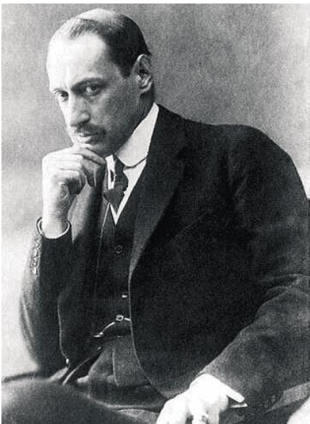
KÁROLYI MIHÁLY, A VÖRÖS-GRÓF

November 24-én lesz 90 éve annak, hogy megalakult elődünk, a Kommunista Magyarországi Pártja. 1918 novemberre és 1919 februárja között a szociáldemokrata kormány mindent megtesz a kommunisták visszaszorítására és a szocialista forradalom megakadályozására. Miután a „békésebb” eszközök nem járnak sikerrel, 1919. február 21-én letartóztatják a KMP 57 ismert vezetőjét. Egy hónapig, egészen 1919. március 21-ig, a Tanácsköztársaság kikiáltásáig kérdéses, hogy a KMP egyáltalán túléli-e az illegális nehézségeit.