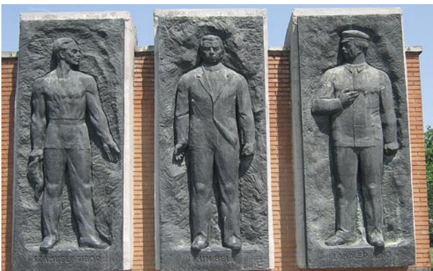
SZAMUELY TIBOR, KUN BÉLA ÉS LANDLER JENŐ. EMLÉKÜK MEGMARAD.

November 24-én lesz 90 éve annak, hogy megalakult elődünk, a Kommunisták Magyarországi Pártja. 1919 márciusában világossá vált, hogy egy megoldás van: a polgári hatalom megdöntése, a Tanácsköztársaság kikiáltása.