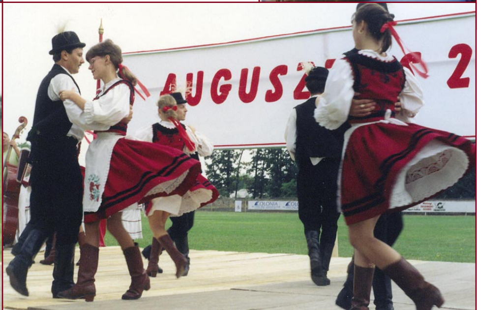
MEZŐKOVÁCSHÁZA, 1995 – AZ ÚJ KENYÉR KÖSZÖNTÉSE ÖSSZEKÖT BENNÜNKET A SZOCIALISTA MÚLTAL, S TISZTELGÉS A MAGYAR VIDÉK NÉPE ELŐTT.