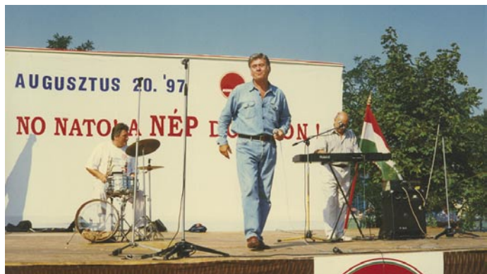
BUDAKALÁSZ, 1997 – POLITIKA ÉS SZÓRAKOZÁS A SZÍNPADON: FÓRUM PEST MEGYE KÖZBIZTONSÁGÁRÓL – VENDÉGÜNK KOÓS JÁNOS.