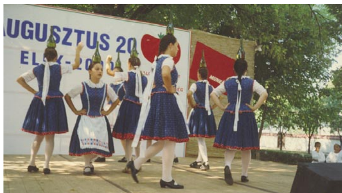
ELEK, 2000 – MAKÓ, OROSHÁZA, MEZŐKOVÁCSHÁZA, ELEK – AZ ELSŐ TÍZ ÉVBEN A VIHARSARKI ÜNNEPEK SZOROZATÁT TARTOTTUK.