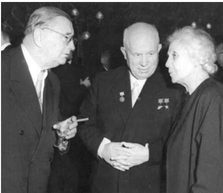
KUN BÉLA ÖZVEGYE MÜNNICH FERENCSEL ÉS NYIKITA HRUSCSOVVAL

November 24-én lesz 90 éve annak, hogy megalakult elődünk, a Kommunisták Magyarországi Pártja.