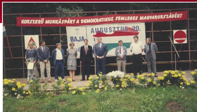
BAJA, 1996 – AZ AUGUSZTUS 20-I ÜNNEP ALKALMAT ADOTT A DEMOKRATIKUS, SEMLEGES MAGYARORSZÁGÉRT, A NATO-ELLENES NÉPSZAVAZÁSÉRT FOLYTATOTT KÜZDELMEINKRE IS.