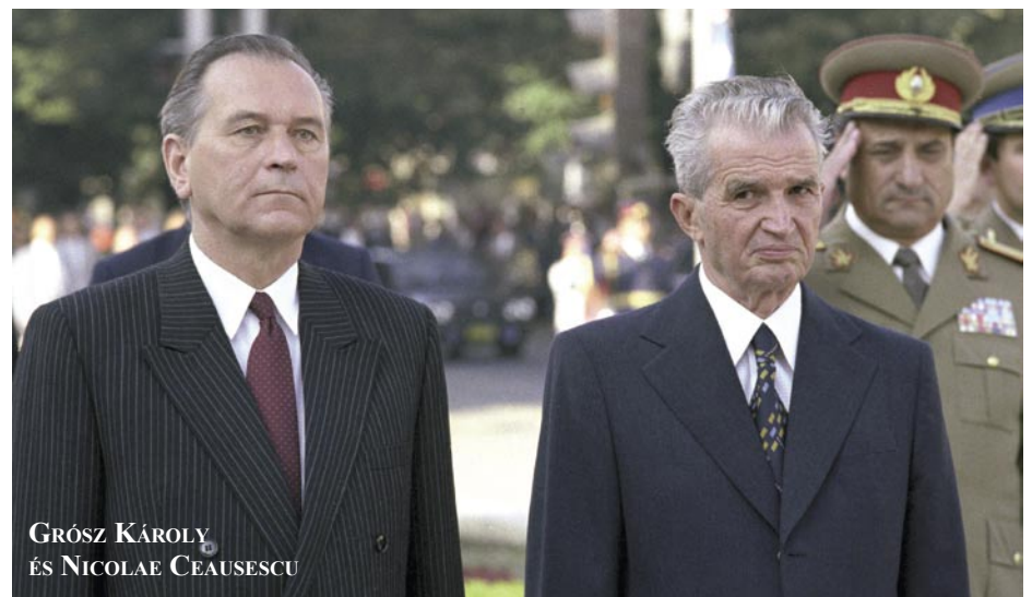
GRÓSZ KÁROLY ÉS NICOLAE CEAUSESCU

Grósz Károlyt 1989 októberében leváltják, az MSZMP-t feloszlatják. Ceausescut 1989 decemberében máig tisztázatlan körülmények között megölik Bukarestben. A szovjetek mindkettőjüknek segítséget ígérnek, de nem segítenek. Szűrös ugyanezen év október 23-án kikiáltja a köztársaságot. Magyarország is, Románia is tőkés útra lép. ■