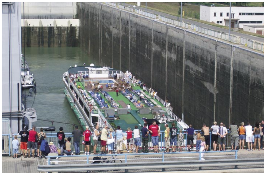
A SZLOVÁKIAI DUNA-SZAKASZON FELÉPÜLT AZ ERŐMŰ

Az erőmű-ügy sajátos módon lejáratta a zöldmozgalmat. Nem véletlen, hogy a mai Magyarországon nincsenek jelentős környezetvédő erők, civilszervezetek. Pont akkor nincsenek, amikor meg kellene védeni az országot a nemzetközi tőkétől, amely sokkal nagyobb környezeti károkat okoz annál, amit a dunai erőműről valaha is gondoltak. ■