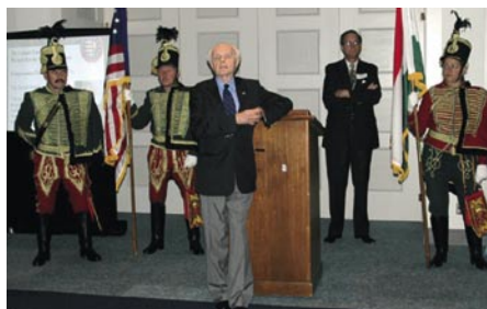
TOM LANTOS, WASHINGTON DÍSZMAGYARJA

Az erőmű ügyének politikai, szocializmus-ellenes felhasználásáért nem az akkori MSZMP vezetése felelős. Ez teljes egészében a rendszerváltó erők műve. Az MSZMP vezetését azért terheli felelősség, ahogyan az ügyet kezelte. Mint eddigi történeteinkben láttuk, az MSZMP vezetése a rendszerváltással összefüggő egyetlen nagy kérdésre sem mondott ígert mindaddig, amíg Kádár János hatalmon volt. Az 1988. májusi pártértekezleten eltávolítják Kádárt, kicserélődik a vezetés. Június 28-án a Politikai Bizottság megtárgyalja az erőmű ügyét, és felkéri a kormányt (ekkor Grósz a főtitkár is, a kormányfő is), hogy a „beruházással kapcsolatos problémákat tekintse át, komplexen vizsgálja meg, beleértve a beruházás