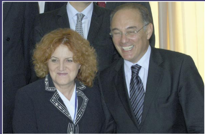
NA, MELYIKÜNK A SZEBB? SZEKERES ÉS VLASTA PARKANOVA CSEH VÉDELMI MINISZTER