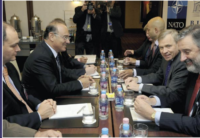
TE, EZEKNÉL NINCS NAGYOBB ASZTAL? NATO ÉS A GYARMATA