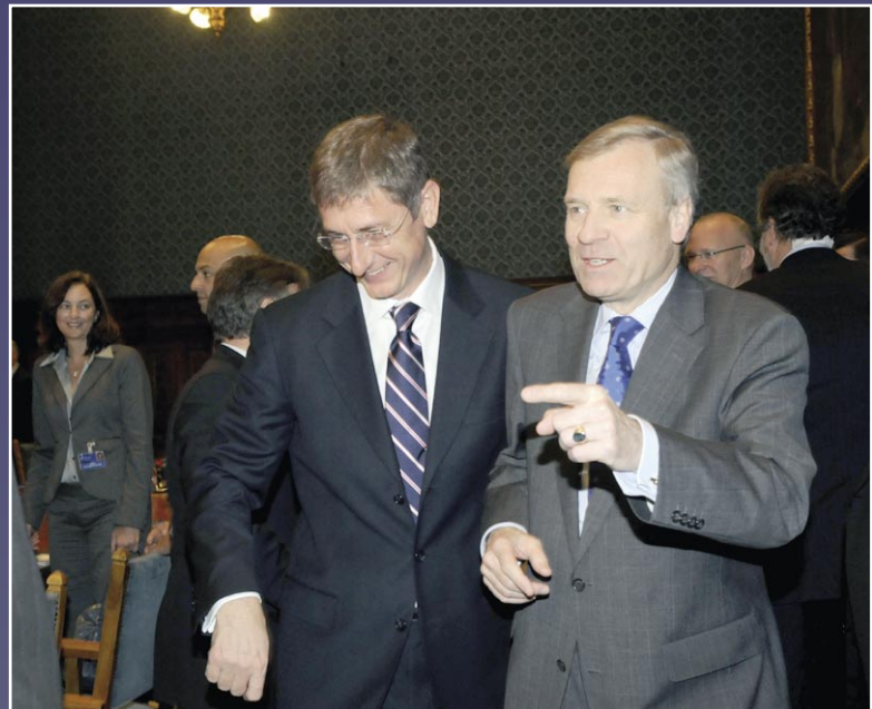
HAZAKISÉREM, MÁR ELEGET IVOTT. SZÖVETSÉGESI ÖSSZETARTÁS