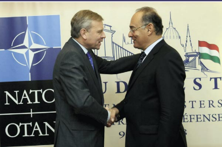
ÍMIKÉM, ANGOLBÓL HOGY ÁLLSZ? A PÉNZNEK NINCS NYELVE