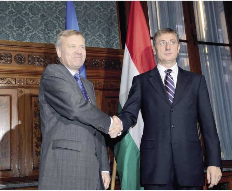
ADDIG SZORÍTOM, AMÍG NEM AD KATONÁT. JAAP DE HOOP SCHEFFER NATO FŐTITKÁR ÉS GYURCSÁNY FERENC