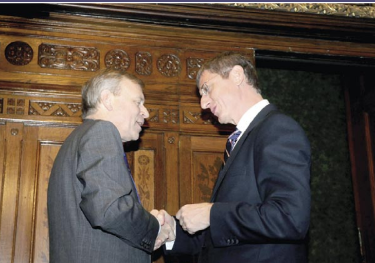
NA, MIT SZÓLSZ, HA IMI LESZ AZ UTÓDOD? LEDUMÁLTÁK...