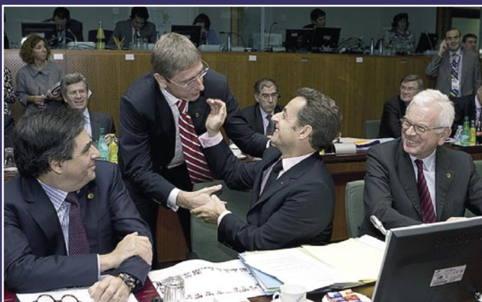
PUSZILLAK FERIKÉM! GYURCSÁNY FERENC ÉS NICOLAS SARKOZY BRÜSSZELBEN