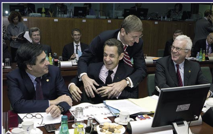
HOL A TÁRCÁM, FERI?! FÉLREÉRTELMEZETT BARÁTSÁG