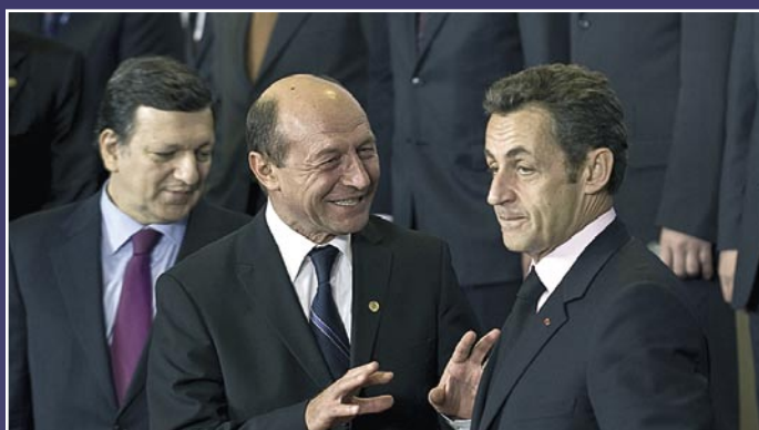
KÜLDJÜK HAZA A FERIT! JOSÉ MANUEL BARROSO EU-FŐNÖK, TRAIAN BASECCU ROMÁN ELNÖK ÉS SARKOZY