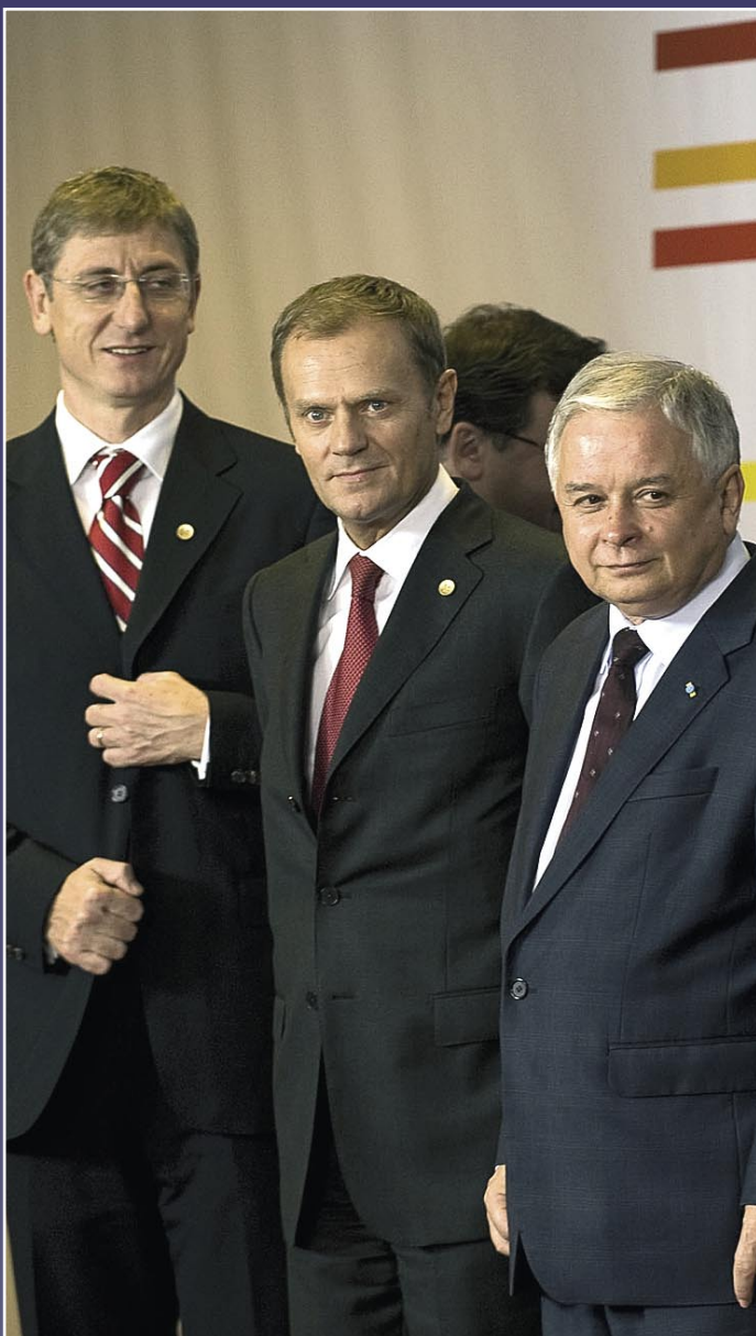
FELNŐTTEK A FELADATHOZ... GYURCSÁNY, DONALD TUSK LENGYEL MINISZTERELNÖKKEL ÉS LECH KACHINSKY ELNÖKKEL