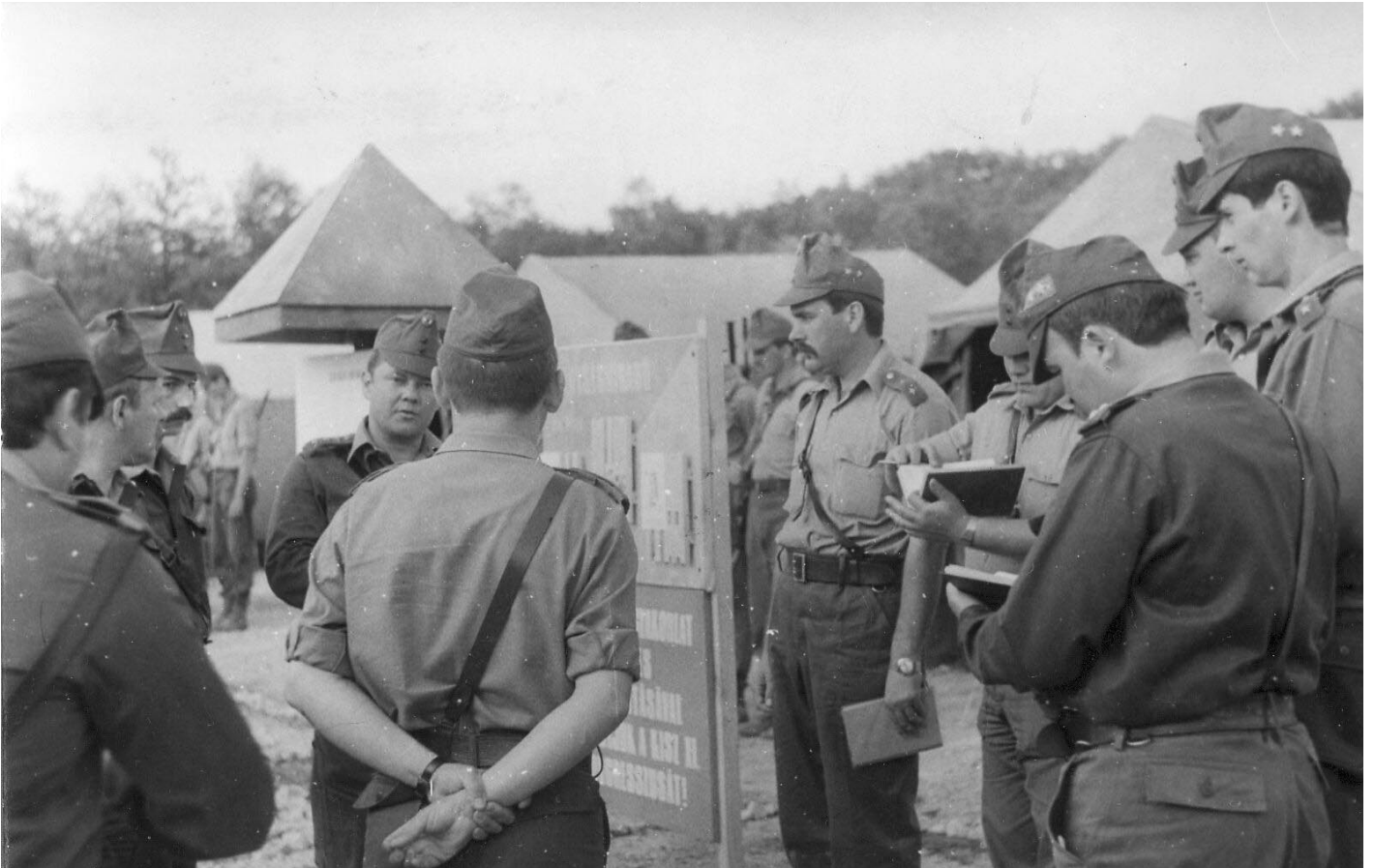
A NÉPHADSEREG MŰKÖDŐ, CSELEKVŐKÉPES SZERVEZET VOLT. TÖNKRETETTÉK