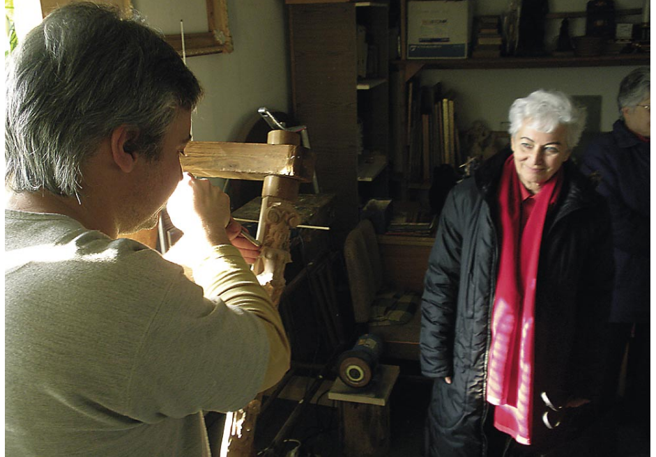
KALAPOS MÁRIÁT VÁROSÁBAN ÉS AZ ÜZEMEKBEN IS JÓL ISMERIK

A párt elnöke felkeresett több vállalkozást és intézményt, köztük a Nüke Kft. Betegszállító Szolgálatát, a városi uszodát és kultúrházat. Meglátogatta a Jusifa Kft. fafaragó műhelyét is, ahol nem is olyan régen több tucat fafaragó dolgozott német exportra. A német gazdaság hanyatlása miatt szobrokra sincs már igény, úgyhogy ketten maradtak. Százezer forint bruttó bérért dolgozik egy tűzoltó, ráadásul rosszabb körülmények között és kevesebb joggal, mint az állami tűzoltók – tudtuk meg a bácsalmási tűzoltó-laktanyában, ahol nagyon élénk beszélgetés alakult ki a pártelnök és a tűzoltók között.