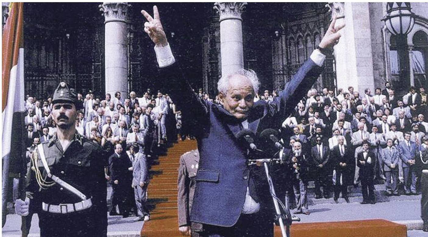
GÖNCZ ÁRPÁD SIKERESEN KIEGYZETT ÖNMAGÁVAL: IRODÁBAN KOSSUTH KÉP, ESKÜ A KORONÁRA

ünnepek és az ezekhez kapcsolódó [...] más megemlékezések alkalmával történő használatát”.