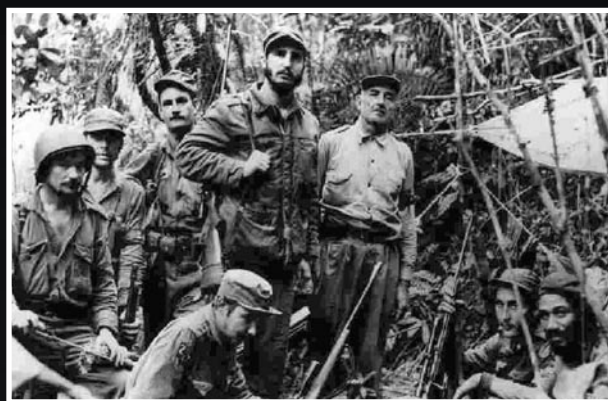
Ötven éves a Kubai Forradalom