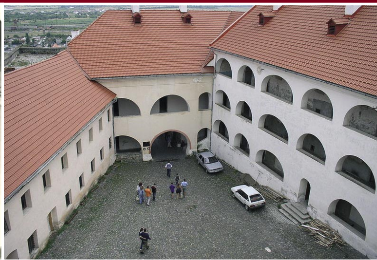
A MUNKÁCSI RÁKOCZI-VÁR GRÓSZ KÁROLY LÁTOGATÁSAKOR ÉS MA. A KÁRPÁTALJAI MAGYAROKKAL AZÓTA SEM TÖRÖDIK SENKI

hető, hogy Gorbacsov segíteni akar. Ekkor még relatíve messze vagyunk a máltai találkozótól, amikor Gorbacsov és Bush amerikai elnök megegyeznek arról, hogy felmondják a jaltai rendszert, és Kelet-Európa amerikai érdekszférába kerül. Erre majd 1989 decemberében kerül sor. Január óta azonban már Bush az elnök. Gorbacsov óvatos, mert a helyzet egyre bonyolultabb. Februárban a szovjet csapatok 20 év után kivonulnak Afganisztánból, de Grúziában, amely akkor még szovjet terület, súlyos zavargások kezdődnek. Áprilisban Kínában elkezdődnek a zavargások, amelyek nyílt ellenforradalmi fellépéshez vezetnek. Gorbacsovnak nem érdeke, hogy Magyarországon zavargások legyenek. Tudja: ha az MSZMP idő előtt szétesik, ellenőrizhetetlen folyamatok indulhatnak el, ez pedig összezavarná Gorbacsov terveit.