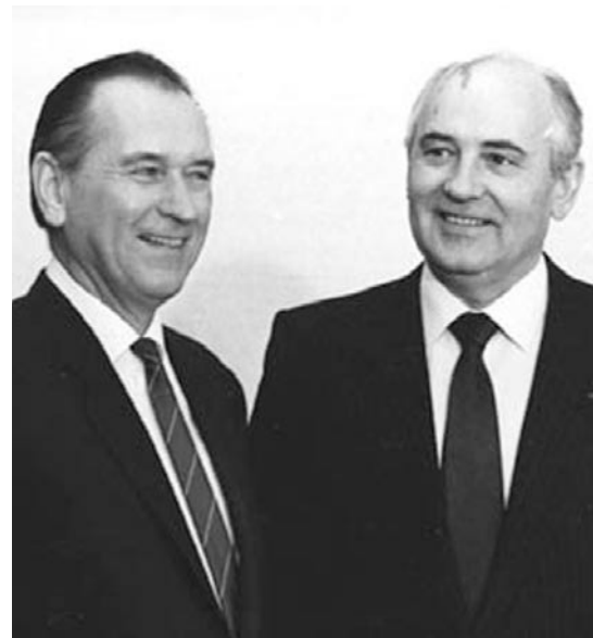
GRÓSZ KÁROLY ÉS MIHAIL GORBACSOV

USA nem akarja destabilizálni a helyzetet, de „teljesen világos az a szándékuk, hogy Magyarországon elősegítsék a saját politikai elképzeléseiknek megfelelő fejlődési út megszilárdulását”. Magyarul ez a kapitalizmus bevezetését, a tőkés ellenforradalmat jelenti.