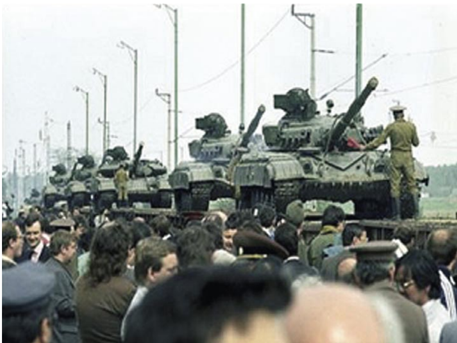
TÁVOZÓ SZOVJET CSAPATOK 1991-BEN

1989 tavaszán a szovjet parlament dönt a fegyveres erők és a katonai kiadások csökkentéséről. Az USA-val megkezdődnek a leszerelési tárgyalások, amelyek azonban a szovjetek egyoldalú leszereléséhez vezetnek. 1989-ben Gorbacsov megtisztítja a pártvezetést olyan kiemelkedő katonai