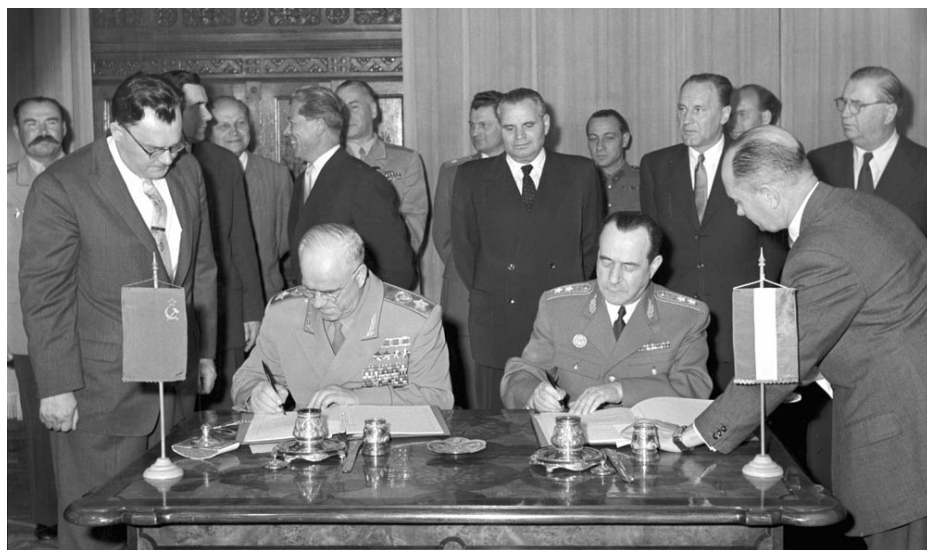
GEORGIJ ZSUKOV MARSALL ÉS RÉVÉSZ GÉZA ALTÁBORNAGY ÍRTA ALÁ A SZOVJET CSAPATOK MAGYARORSZÁGON ÁLLOMÁSOZÁSÁT BIZTOSÍTÓ EGYZEMÉNYT. KATONAI ÉS POLITIKAI DÖNTÉS SZÜLETETT

Az 1990-ben aláírt megállapodás értelmében 1991. június 30-án fejeződött be hivatalosan a szovjet csapatok kivonása Magyarországról. Az Országgyűlés 2001. május 8-án fogadta el az ország szabadsága visszaszerzésének jelentőségéről és a „Magyar Szabadság Napjáról” szóló előterjesztést, amely június 19-ét nemzeti emléknaprá nyilvánította. 1999. március 12-én Magyarország belép a NATO-ba, két héttel később megkezdődik a háború Jugoszlávia ellen. Taszár lett az AFOR és SFOR erők központi bázisa. Az USA fokozatosan kiépíti katonai, rendőri és polgári jelenlétét Magyarországon. 2001-ben megkezdődik a háború Afganisztánban, természetesen magyar részvétel mellett. ■