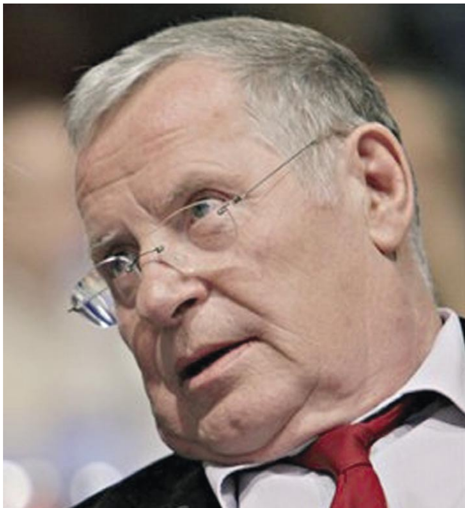
JELENLEG A NÉMET LOTHAR BISKY AZ EBP ELNÖKE. SZÁMTALAN ALKUT KÖTÖTT