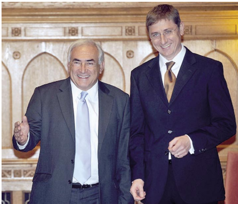
DOMINIQUE STRAUSS-KAHN IMF ELNÖK ÉS GYURCSÁNY FERENC. MULATNAK

Kovács László, akkori magyar külügyminiszter-helyettes 1989. április végén Tel Avivban tárgyal a teljes jogú magyar-izraeli diplomáciai kapcsolatok helyreállításáról. „Most jó alkalom kínálkozik, hogy a magyar külpolitika végre tanújelét adhatná nagykorúságának, vagyis önálló cselekvő-