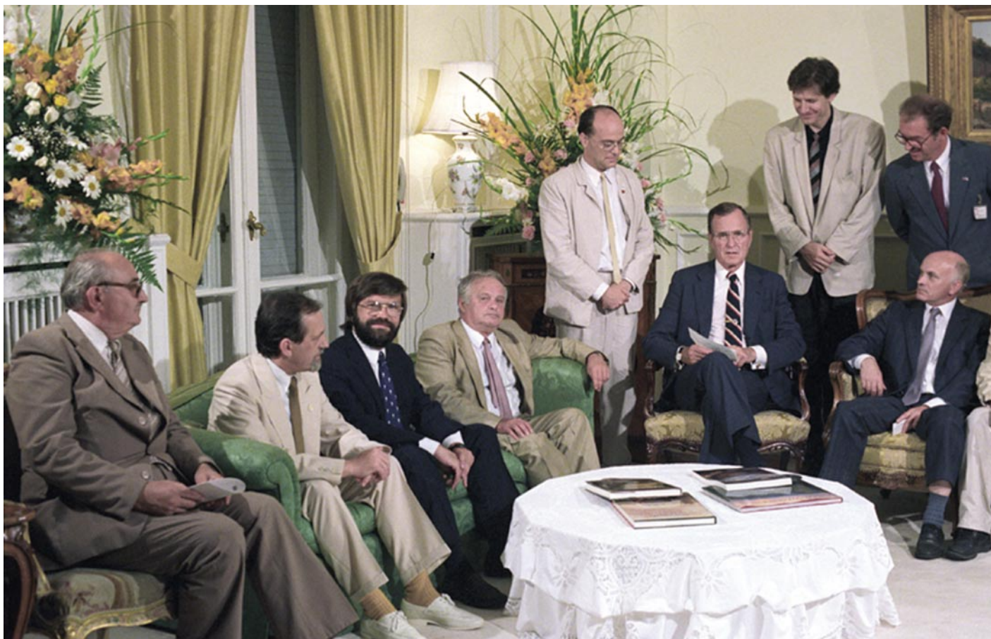
MAGYAR ELLENZÉKIEK ÉS GEORGE BUSH. AZ AMERIKAI ELNÖK LÁTNI AKARTA, KINEK FIZET