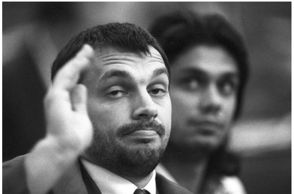
ORBÁN VIKTOR ÉS DEUTSCH TAMÁS

Augusztus 26-án a prágai kerületi bíróság úgy dönt, hogy bíróság elé állítják Deutsch Tamást és Kerényi Györgyöt. Válaszul Budapesten, a csehszlovák nagykövetség előtt folyamatos tüntetéseket szervez az SZDSZ és a Fidesz. Az akcióban számos magyarországi ellenzé-