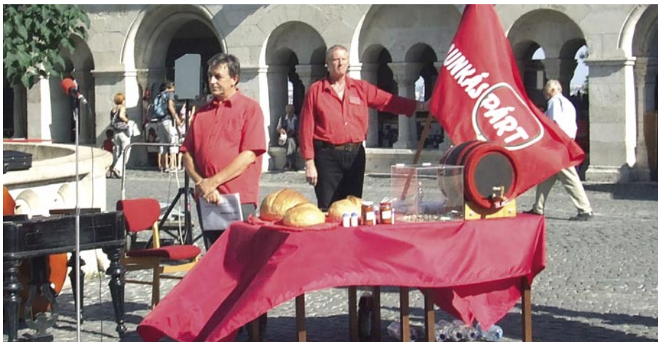
A KOMMUNISTÁK ÚJ KENYÉRREL, JÓ BORRAL ÉS CIGÁNYZENÉVEL KÖSZÖNTÖTTÉK AZ ÜNNEPLÓKET

A hidegháborúnak vége. A béke azonban nem jött létre. Most már csak olyan területeken lehetne új földeket szerezni, ahol az ár nagyon magas: a háború. Politikai háború, amit mindennap látunk az EU, az USA és Oroszország között. Energiaháború, ám a Déli Áramlat kontra Nabucco ügyben már el is indult. Válási háború, és ezt nagyon komolyan kell venni, hiszen az EU és a NATO bővítése eljutott a klasszikus katolikus Európa határáig. Belarusz, Ukrajna, Szerbia nem katolikus, hanem görögkeleti, Törökország muzulmán. Forró háború, amihez meg már készülődnek. Ugye, nem gondolják komolyan, hogy Pápára azért telepítenek hatalmas katonai szállítógépeket, hogy humanitárius segélyekkel lássanak el boldog-boldogtalant?