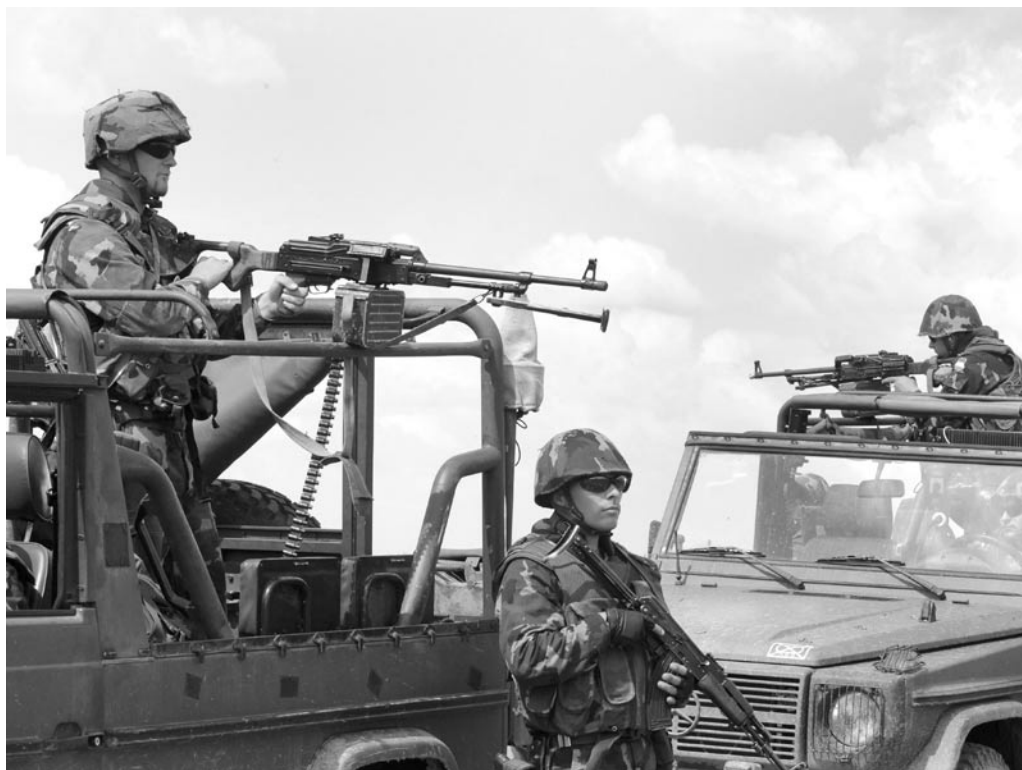
MAGYAR KATONÁK AFGANISZTÁNBAN. MI A VÉR ÁRA?

A Munkáspárt helyesli, hogy a kormányzat a bolognai folyamat szerepét csökkenteni kívánja. Az érettségi vizsga és a felsőoktatási intézménybe való felvétel egyes szabályainak módosítása fontos lépés lehet az egységes felvételi rendszer megeremtése felé. Egyetért azzal, hogy az eddigi osztatlan egyetemi szakok mellett (orvosi, mérnöki, jogi), a tanári képzésre is kiterjeszti az osztatlan szakok számának növelését. Ugyanakkor alapvetőnek tartja az alap kutatásokat megalapozó elméleti szakágazatokban is az egylépcsős felsőoktatási rendszer kibővítését, a hazai kutatóbázisok fejlesztését.