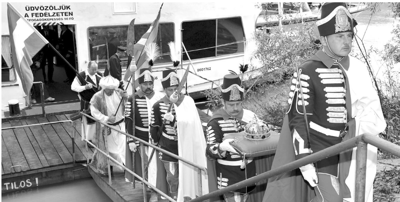
A KÖZTÁRSASÁG NEM KIRÁLYSÁG. A KORONA NEM PÁRT-SZIMBÓLUM!

is tegyen. Ennek ellentmond, hogy a kormány nem ítélte el egyértelműen a segítségnyújtást szállító hajók elleni izraeli támadást, annak ellenére, hogy azt az EU számos állama elítélte.