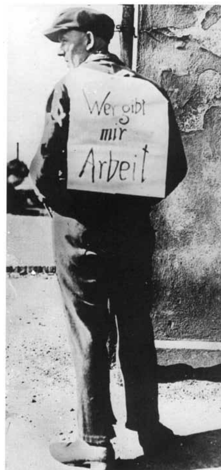
KI AD NEKEM MUNKÁT?

Álljon a front mint a penge éle! Hahó, mindenki a helyére! Hahó, mindenki a helyére! Törjön a kéz, mely konkolyt hintett, Egy sorba, hej, seregeinket! Sorakoznak a barna ingek. Fekete, fehér, barna ingek, Hahó, vigyázz. ma éjjel megölnének minket! Hát frontba, elvtárs, védd magad! Csituljon a test vérharag! Hallgasson most a sunyi száj, Némuljon a pártos viszály! Az idő vészharangja kong, szemközt velünk fasiszta front rohamzászlóját bontja ki. Kigyúlt a ház! Lángol a ház! Hát jöjjetek valamennyien oltani! Helyed üresen áll a sorban, hát állj be, elvtárs! Állj be, elvtárs! Gyáva, ki tétováz, ki torpan és áruló, ki bont, ki ront, hát állj be, elvtárs, hív a front! Fel, harcra, elvtárs, hív a front!