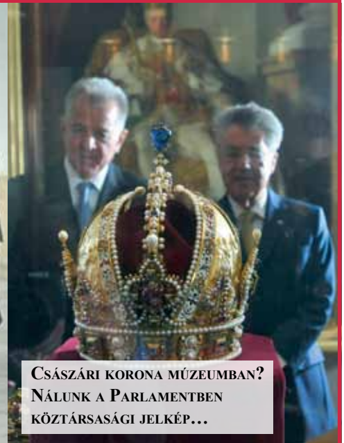
CSÁSZÁRI KORONA MÚZEUMBAN? NÁLUNK A PARLAMENTBEN KÖZTÁRSASÁGI JELKÉP...