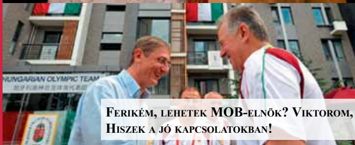
FERIKÉM, LEHETEK MOB-ELNÖK? VIKTOROM, LEHETNÉK KÖZTÁRSASÁGI ELNÖK? HISZEK A JÓ KAPCSOLATOKBAN!