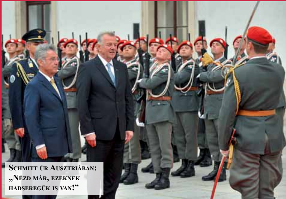
SCHMITT ÚR AUSZTRIÁBAN: „NÉZD MÁR, EZEKNEK HADSEREGÜK IS VAN!”