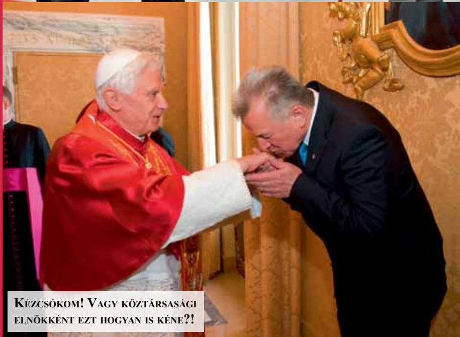
KÉZCSÓKOM! VAGY KÖZTÁRSASÁGI ELNÖKKÉNT EZT HOGYAN IS KÉNE?!