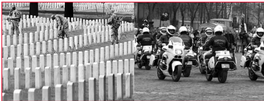
A MAGYAR KATONÁK AMERIKAI ÉRDEKEKÉRT HALTAK MEG. KI GONDOL A MAGYAR RENDŐRÖKRE?

Viszont a magyar vezetés szégyellje magát!