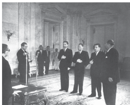
RAJK, KÁDÁR, KOSSA

Az SZDP vezetésében azonban erős a jobboldal is. Peyer Károly és Buchinger Manó, két régi ismerősünk ekkor még nincsenek itthon. Így előtérbe kerül Kéthly Anna. Kéthly ekkor már 56 éves. 1919-től tölt be vezető tisztségeket a szociáldemokrata mozgalomban. A Horthy-rendszerben Slachta Margit után ő volt a második és másfél évtizeden keresztül az egyetlen képviselő a parlamentben. 1945 után a párt egyik vezető alakja. 1948-ban majd ellenzi a kommunisták és a szociáldemokraták egyesülését. 1956-ban majd ő vállalkozik az SZDP újjászere-