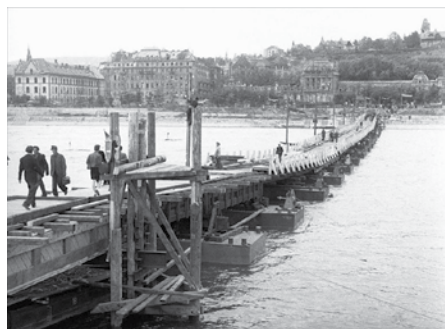
AZ ELSŐ PONTONHÍD A DUNÁN

Az MKP a helyreállítást az első perctől kezdve összeköti a dolgozók alapvető követelésével: 8 órás munkanap, fizetett szabadság, a női és gyermekmunka megszüntetése, munkahelyteremtés. A kommunisták földreformot, a bányák, a „közérdeket szolgáló” vállalatok, a biztosítási rendszer államosítását, a „hadinyereségek