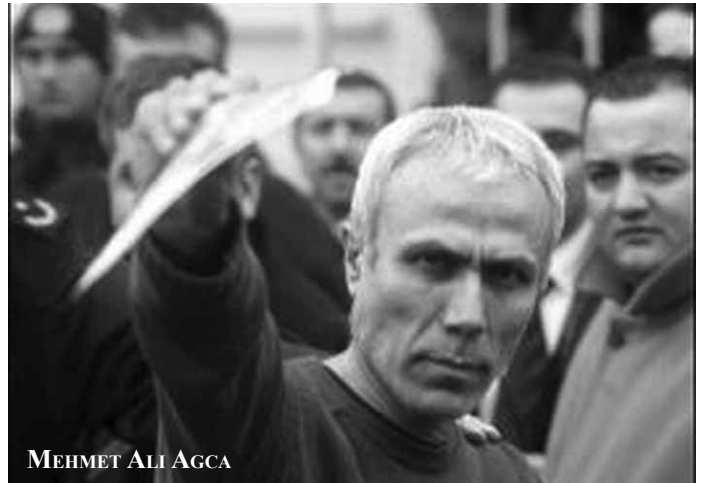
MEHMET ALI AGCA

A merénylet kitervelője Agca szerint Agostino Casaroli bíboros, vatikáni államtitkár, a Szentszék akkori keleti politikájának irányítója volt. Agca azt a feladatot kapta, hogy ne a pápa fejére vagy szívére, hanem a hasára célozzon. II. János Pált a lövések súlyosan megsebesítették, de a pápa nem halt meg. Agca azt állította, hogy 40-50 ezer dollárt kapott a merényletért.