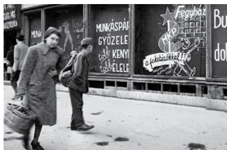
VÁLASZTÁSI KAMPÁNY, 1945

Mai tapasztalatból is tudjuk, hogy a választásokon majdnem mindent eldönt az, hogy milyenek a játékszabályok. Az MKP 1945-ben már a játékszabályok,