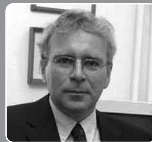
Pokorni Zoltán (Fidesz)

- országgyűlési képviselő (1 085 292 Ft) - Szeged polgármestere (670 800 Ft) Összesen: 1 756 092 Ft