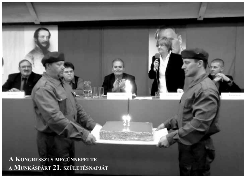
A KONGRESSZUS MEGÜNNEPELTE A MUNKÁSPÁRT 21. SZÜLETÉSNAPIJÁT

Köszönjük a látogatást, bízunk a mielőbbi viszontlátásban!