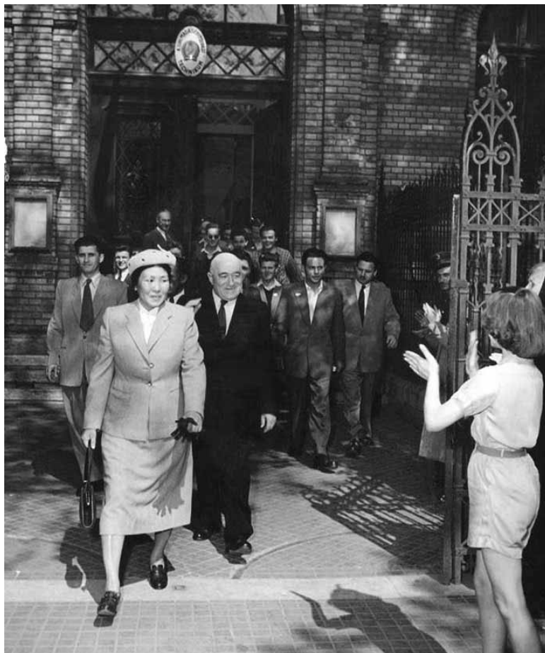
RÁKOSI ÉS FELESÉGE SZAVAZ

A kádári korszak e gyakorlatának sok negatív következménye is van. A baloldali emberek zöme fegyvertelenül áll a mostani, a tőkés, kommunista-ellenes kampányokkal szemben. Hiszen nem tudják, ki volt Nagy Imre. Az 50-es évek