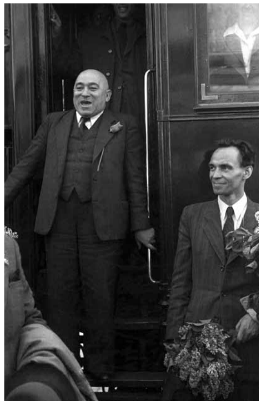
RÁKOSI ÉS RAJK 1946-BAN

A Rajk-ügyre nincs mentség, és nem is szabad mentegetni. A Rajk-ügy nem a szocializmus törvényszerű következménye, hanem az akkori pártvezetők súlyos tévedése, hibája és bűne. A hidegháborús feszültségnek kétségkívül szerepe van az eseményekben. Nem férhet kétség ahhoz, hogy a tőke meg akarja semmisíteni a szocialista világot. Ez azonban nem elég magyarázat. Igaz