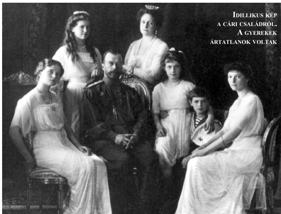
IDILLIKUS KÉP A CÁRI CSALÁDRÓL. A GYEREKEK ÁRTATLANOK VOLTAK

Lenin ezután javasolta a cári család Moszkvába szállítását, és alighanem ez pecsételte meg a sorsukat. ■