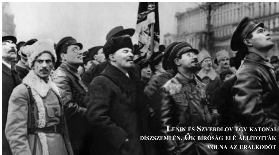
LENIN ÉS SZVERDLOV EGY KATONAI DÍSZSEMLÉN. ŐK BÍRÓSÁG ELÉ ÁLLÍTOTTÁK VOLNA AZ URALKODÓT

Szolovjov kifejtette: mivel a cári család arra törekszik, hogy a kivégzetteket