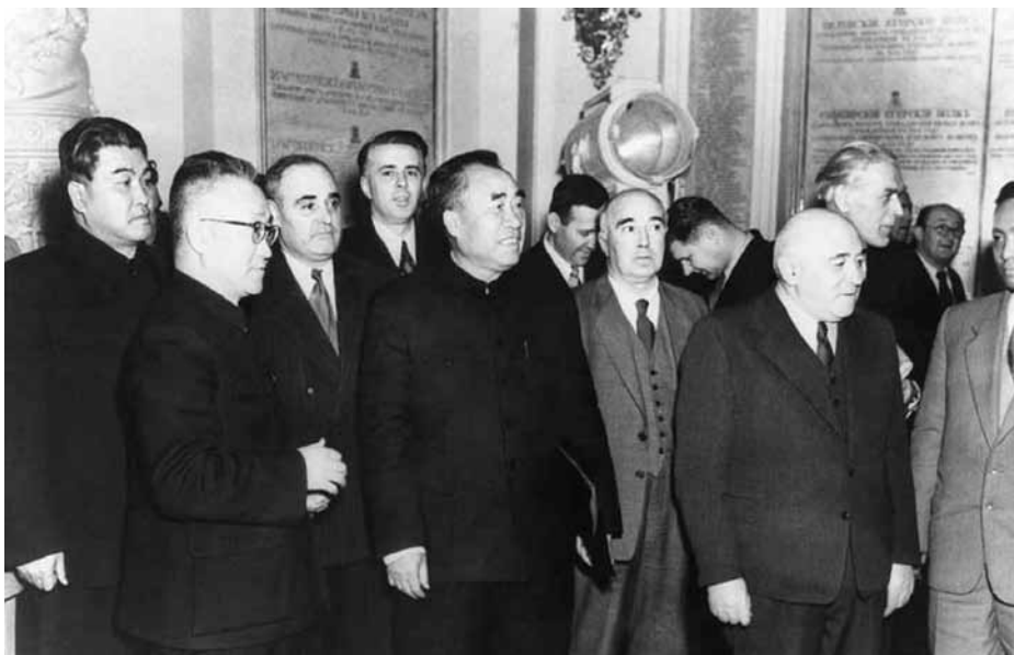
RÁKOSI MOSZKVÁBAN, 1956

Imre nem kerül bele a perbe. Sztálin felhívja Rákosi figyelmét arra, hogy a párt „bármennyire is népszerű, csak kicsiny része a népnek”. Legyenek óvatosak, Matvej Joszifovics, mondja Sztálin. Így hívták egymás között Rákosit.