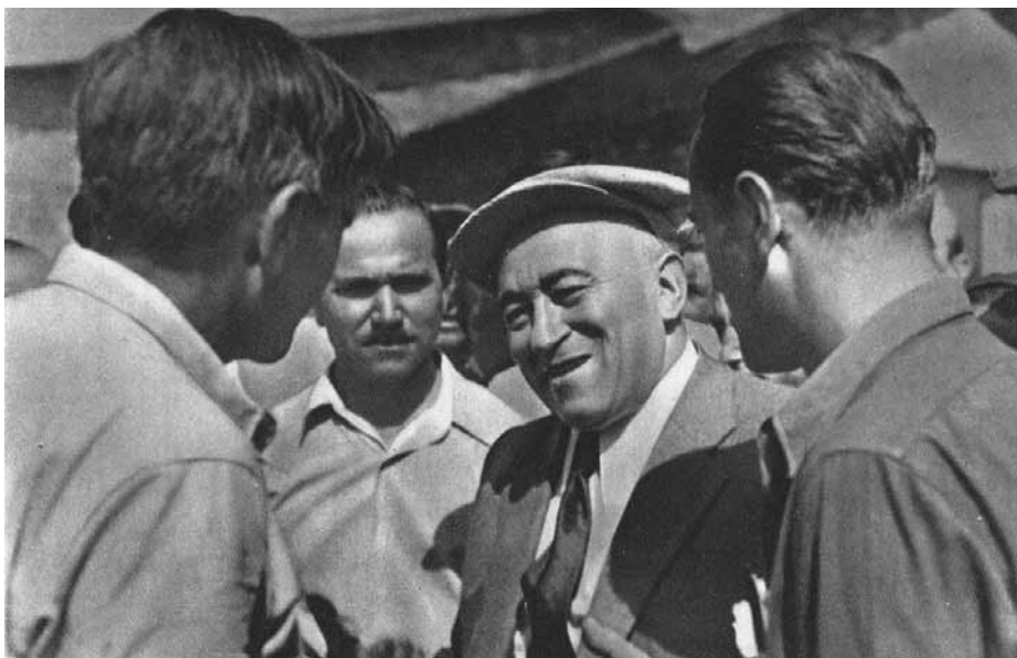
RÁKOSI MÁTYÁS MUNKÁSOK KÖZÖTT

Szakasits Árpád, a szocdemek vezetője fenntartással kezeli, hogy a kommunisták meghatározó emberei, Rákosi, Farkas, Gerő, Révai, Vas a Szovjetunióból jöttek.