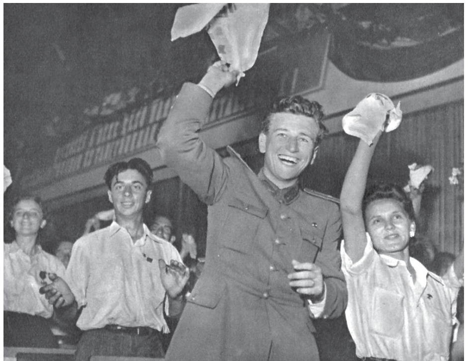
A DISZ MEGALAKULÁSA, 1950

Az MDP folyamatosan meglévő dilemmája, hogy tömegpárt legyen, vagy élcsapat-párt. Nem beszélve arról, hogy senki sem tudja, hogy egy 10 milliós országban mi számít soknak. 1950 szeptemberében 828 ezer tagja van a pártnak. A tagok 57,4 százaléka munkás, 23,8 százaléka paraszt, az értelmiség 4 százalékot tesz ki. Az MDP vezetése azonban elégedetlen. „Párttagságunk számszerű növekedése nem kielégítő, messze elmarad a dolgozó tömegek politikai fejlődésétől. Nincs lényeges javulás a párttagság összetételében sem, sőt a dolgozó parasztként aránya lényegesen csökkent” – olvashatjuk a Politikai Bizottság határozatában.