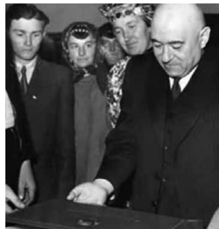
RÁKOSI SZERETETT EMBEREKKEL MUTATKOZNI

Mit jelentett ez a gyakorlatban? Először is, működtek ugyan a kollektív vezetés intézményei, de az alapvető döntéseket négy ember, Rákosi, Gerő, Farkas és Révai hozták. Ennek középpontjában a főtávkár, Rákosi állt. Rákosi számos kérdésben személyesen döntött. Személyesen utasította például az állambiztonsági szerveket. Másodszor, a pártvezetés, személyesen Rákosi átvette a kormány, az állami szervek funkcióit. Harmadszor, a vezetés fokozatosan elszakadt