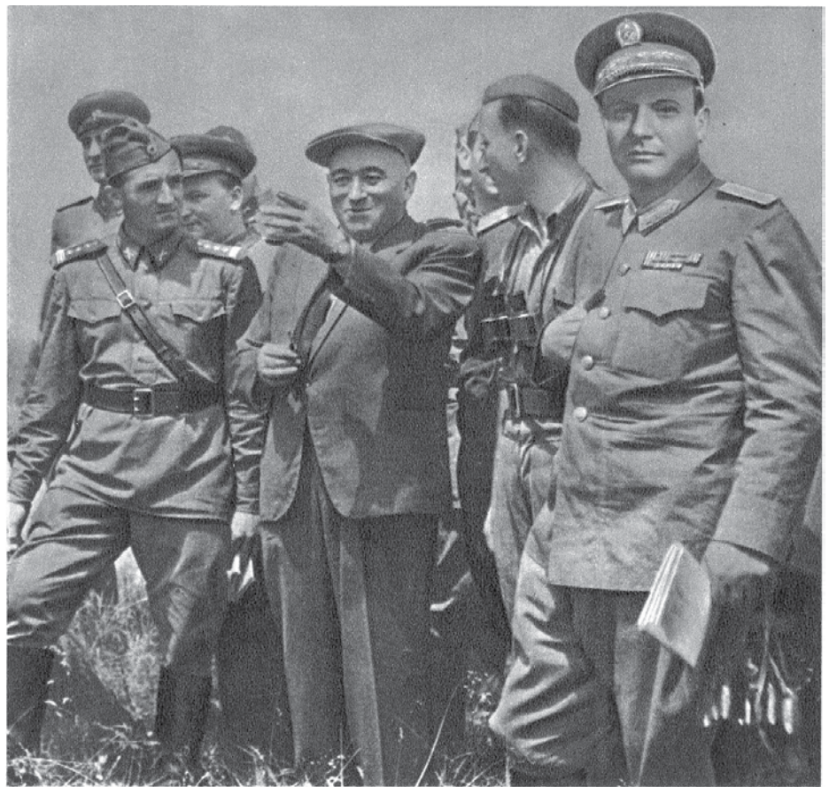
HADGYAKORLAT: RÁKOSI MÁTYÁS, FARKAS MIHÁLY

A szocializmus első szakaszának, az ötvenes éveknek a politikai intézményeit nem lehet a polgári demokrácia mércéi alapján megítélni. Abban a konkrét helyzetben kell vizsgálni, amely az adott társadalmi rendszerre és az adott korra vonatkozik. 1948-tól Magyarországon szocialista társadalmat építenek. Létrejönnek az alapvető politikai intézmények, a