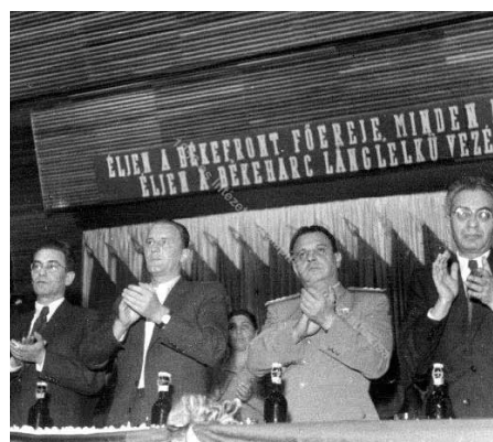
RÉVAI JÓZSEF, KÁDÁR JÁNOS, FARKAS MIHÁLY, GERŐ ERNŐ

Vitathatatlan, hogy a törvénytelen-ségek ellen jogos és igazságos fellépés határozott változásokat igényelt az állambiztonsági szerveknél is. Péter Gábor altábornagy, az Államvédelmi Hatóság ve-