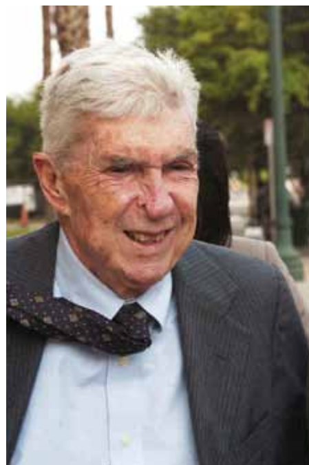
POSADA MÁR FELMENTETTEN RÖHÖGHET

Megfigyelők szerint Posada felmentése rontja annak esélyét, hogy Washingtonnak belátható időn belül sikerül kies-