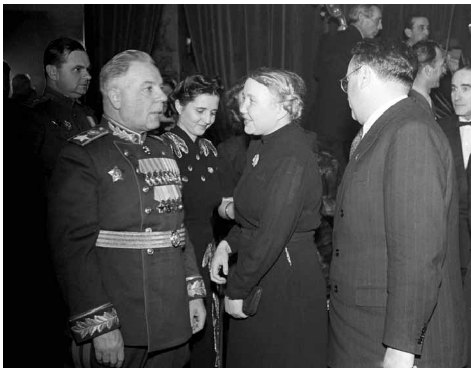
VOROSILOV, VADAS SÁRA ÉS VAS ZOLTÁN, 1946.

Más a helyzet 1990 után, a tőkés világban. 2007-ben maga az Állami Számvevőszék már megállapítja: „Magyarországon nincs olyan megfelelő tervezés, amelynek segítségével sokoldalú válaszokat tudnánk adni a globális, az EU-felzárkózással és a szociális védőháló megerősítésével járó kihívásokra”.