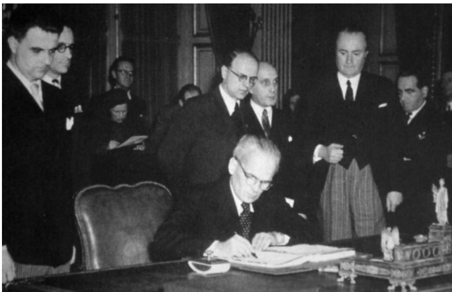
GYÖNGYÖSI JÁNOS KISGAZDA POLITIKUS, AZ ALKOTMÁNY EGYIK MEGALKOTÓJA

Mit adott az 1949-es alkotmány a dolgozóknak? A válasz egyszerű: a hatalmat, azt a lehetőséget, hogy a dolgozók döntsenek saját sorsukról. „A Magyar Népköztársaság a munkások és dolgozó parasztok állama. A Magyar Népköztársaságban minden hatalom a dolgozó népé. A város és falu dolgozói választott és a népnek felelős küldöttek útján gyakorolják