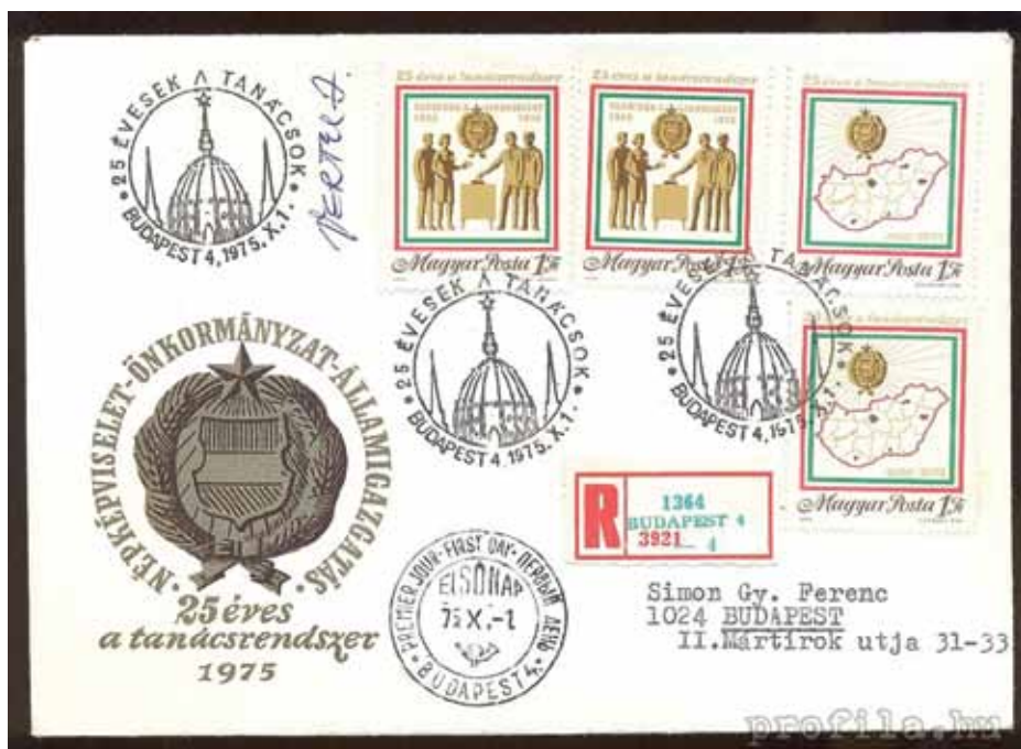
EMLEKBÉLYEGEK A TANÁCSRENDSZER 25. ÉVFORDULÓJÁN

fizették abban a térségben, ahol dolgoztak. A budapestiek például budapesti BKV-bérletet kaptak a bérletrendszer bevezetése után. A mai önkormányzati képviselők zöme nem csak költségtérítést, de fizetést is kap a munkájáért.