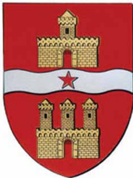
BUDAPEST SZOCIALISTA CÍMERE

A mai önkormányzatok testületeiben a pártok által jelölt emberek ülnek, többségükben semmilyen államigazgatási ismeretük sincs. Az önkormányzatokban nincs végrehajtó bizottság, így az egész munka túlpolitizált. Mivel az önkormányzatok politikai alapon jönnek létre, gyakran az apparátusokat is politikai emberekkel rakják tele. A mai önkormányzatokban a bürokrácia sokszorosa annak, ami a tanácsrendszerben volt.