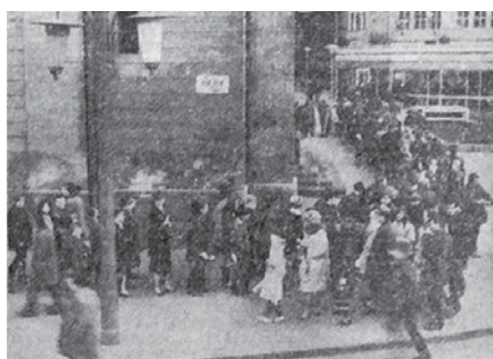
1970, AZ ELSŐ METRÓVONAL MEGNYITÁSA

A tanácsokat 1950-ben kezdik felállítani. A törvényi háttér kidolgozásáért, a munka összefogásáért az akkori belügyminiszter a felelős, aki nem más, mint Kádár János. A feladat nem egyszerű. 1951. februárjában az MDP Politikai Bizottsága megállapítja: „A tanácsok ma még nem szilárd szervei a népi demokrácia államhatalmának”. Miért? Nos, nincs elég tapasztalat. Sok a bürokrácia, a központ gyakran élösködni akar a helyi szerveken, kevés a képzett szakember. S, még hat a múlt is. 1951 nyarán még közel tízezer olyan helyi közigazgatási dolgozó tevékenykedik a tanácsokban, akik a Horthy-rendszerben