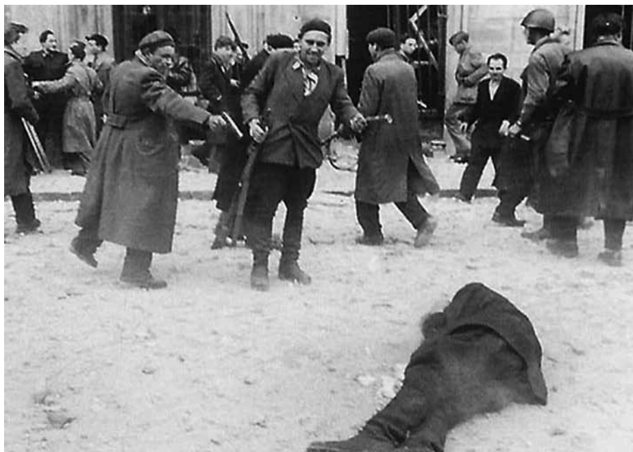
ÁVH-S KATONÁKAT LINCSELNEK 1956-BAN

A mai Munkáspárt új programjának tézisei erről a következőket mondják: „Sok oka van annak, hogy ilyen helyzet jöhessen létre 1948-56 között. Nem vitatható, hogy szükség van a hatalom bizonyos koncentrációjára, hiszen, sose feledjük, ez a hidegháború, a nemzetközi és a hazai osztályharc legkeményebb időszaka. Másrészt, Rákosi és vezetőtársai előszeretettel másolják azt, amit láttak a Szovjetunióban. A felelősséget nem lehet a szovjetekre kenni, de tény, hogy akkor csak ez a tapasztalat állt rendelkezésre. Harmadrészt, és ez nagyon fontos: ekkoriban még túl fiatalok a szocializmus politikai intézményei. Három-négy év után nem lehet elvárni, hogy egy elvileg is új gépezet jól működjön. Mindebből következik két dolog: a személyi kultusz, a politikai intézmények torzulása nem a szocializmus, mint rendszer következménye. Másrészt, ami megtörtént a szocializmus kezdeti szakaszában, az – éppen a tapasztalatok birtokában – elkerülhető a jövőben, egy új szocialista társadalom megteremtésekor.”