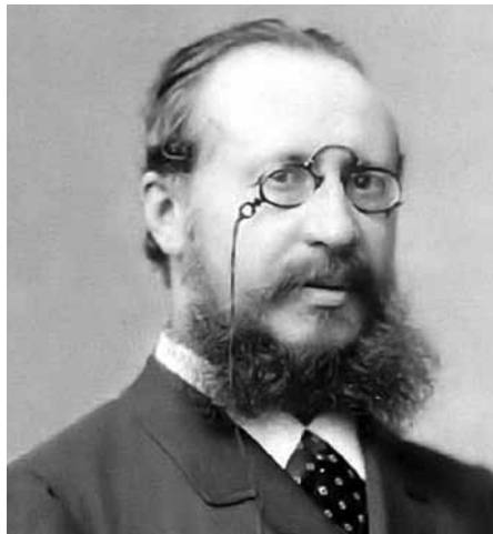
SZÉLL ÉS TARLÓS: HASONLÓ KALIBER

Széll Kálmán paktummal került a miniszterelnöki székbe, beválatlan ígérekkel vezette félre a közvéleményt, egyéni érdekek kielégítésével némította el az ellenőrzés kritikáját, s ami a politikai morált illeti, a Széll Kálmán eddigi kormányelnöksége nem nagyon igazolta híres teóriáját a politikai becsületről.