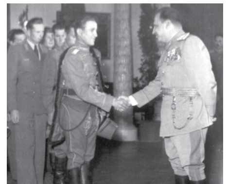
FARKAS MIHÁLY TÁBORNOKI DÍSZBEN

Megszületik egy új munkás-paraszt értelmiségi réteg, amely a következő évtizedekben különböző szinteken irányítja a nép hadseregét. 1950-ben Janza Károly 36 éves, egykori vasesztergályos, hadtápfőnök, majd honvédelmi miniszter. 1953-ban az egykori gyári tűzoltó, majd