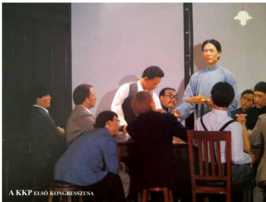
A KKP ELSŐ KONGRESSZUSA

megújulásra, a szocializmus reformjára. A reform és nyitás koncepciója, a kínai sajátosságú szocializmus programja a 20. századi marxista gondolkodás maradandó értéke. Deng Xiaoping, a kínai reform atyja elméleti szinten bizonyította, hogy a szocializmus, mint társadalmi rendszer lényegét tekintve jobb és emberibb, mint bármely tőkés rendszer. Bizonyította, hogy a szocializmus – a 20. század folyamán tapasztalt számtalan gondja és problémája ellenére – megreformálható.