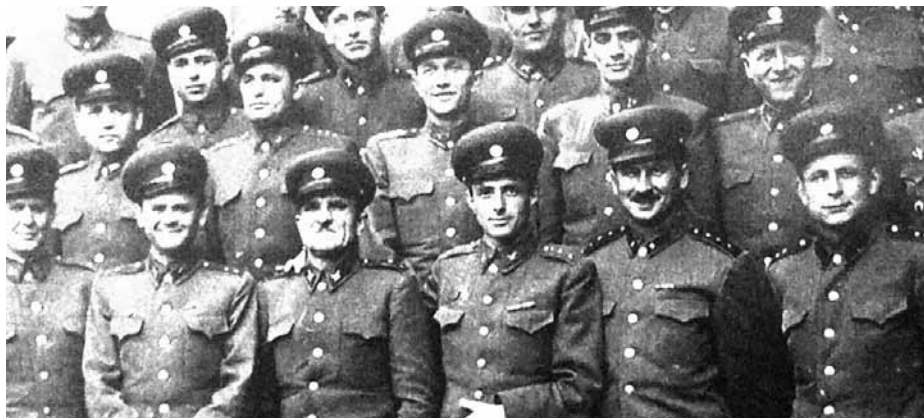
A NÉPHADSEREG TISZTJEI AZ 50-ES ÉVEKBEN

1948-ban az MDP a párt védelmi politikájának irányítására speciális szervet hoz létre, az MDP Katonai Bizottságát, amelyet később egyesítenek a Belügyi Bizottsággal, és létrejön az MDP Államvédelmi Bizottsága. Ez amolyan nemzetvédelmi központ, amelyhez hasonló szinte minden államban működik. Elnöke Rákosi, a főtitkár, ott van Farkas Mihály is, és Kádár János belügyminiszter is. 1952-ben a szervezet Honvédelmi Tanácsá alakul, amely a párt katonai ügyekben illetékes legfelsőbb vezetőiből áll.