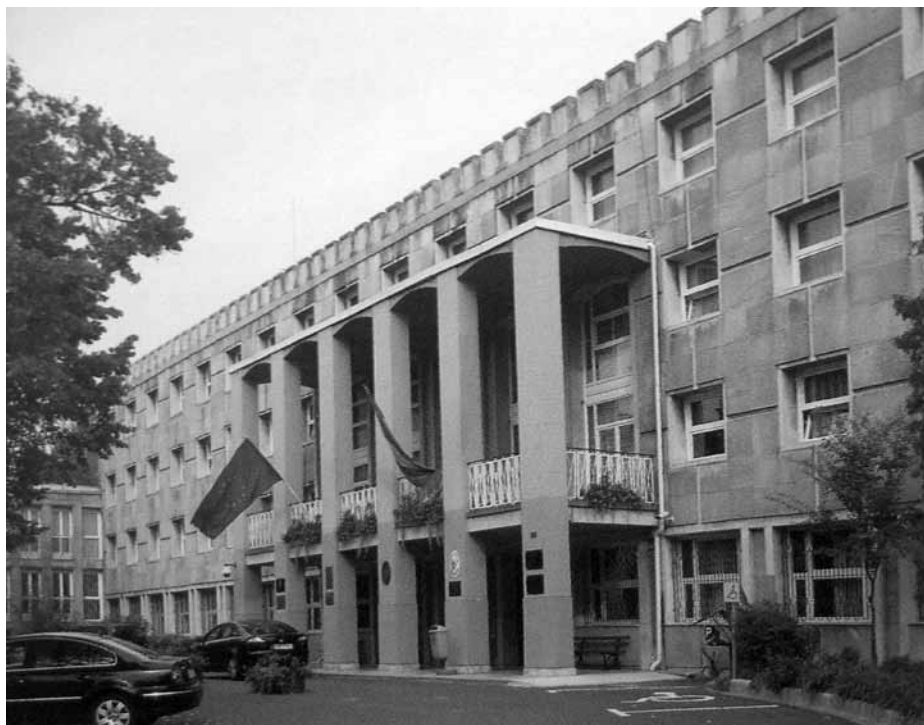
A NÓGRÁD MEGYEI TANÁCS ÉPÜLETE AZ 1950-ES ÉVEKBEN

Nagy sajátos többpártrendszeret képzelt el, ahol a kommunista párt monopolhelyezete megszűnik. Több önálló párt van, de ezek lojálisak a szocializmushoz. Nagy szerint a párt és az állam egymástól szinte függetlenül működnek, a párt irányító szerepe nem érvényesül a biztonsági szolgálatok, a hadsereg felett sem. A Hazafias Népfrontot olyan szervezetnek