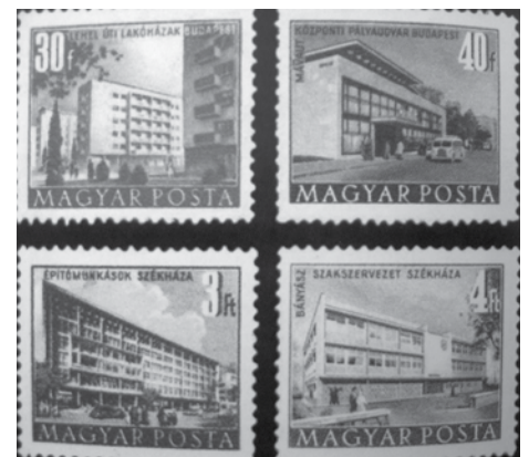
AZ 1950-ES ÉVEK, BÉLYEGEN

Kádár János 1985. szeptemberében a következőket mondja Gorbacsovnak: