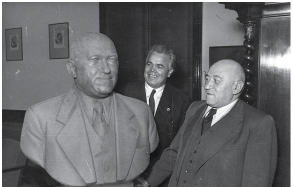
RÁKOSI SAJÁT SZOBRÁVAL

„Hadd érezzék, a szentségit, hogy proletárdiktatúra van!” – magyarázza utólag, 1960-ban Rákosi az 1950-es években elkövetett törvénysértéseket. Rákosi ezt a forradalom természetes állapotának