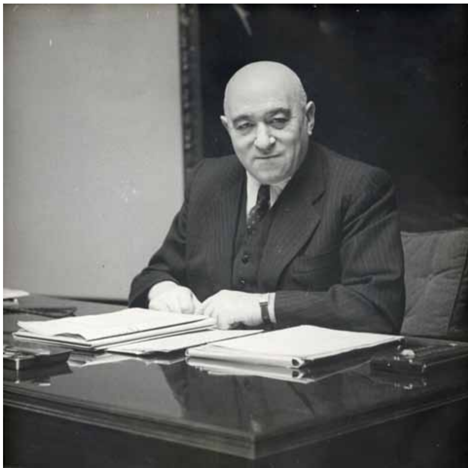
RÁKOSI A DOLGOZÓSZOBAJÁN

A revizionizmus és a dogmatizmus egyaránt kárt okoz a munkásmozgalomnak, de nem azonos módon. Mint korábbi írásunkban láttuk, Nagy Imre revizionista politikája azt jelenti, hogy ugyan forradalmi, marxista jelszavakba öltözik, de valójában egyre inkább kitolni igyekszik a szocializmus határait a kapitalizmus felé, és egy ponton át is lépi azokat. Nagy Imre fellazítani igyekezett a pártot és a munkás-parasztállamot olyan időszakban, amikor arra lett volna szükség, hogy új módszerekkel, demokratikusan, széleslátókörűen, de a szocializmus, a dolgozó tömegek érdekeit védjék, sőt