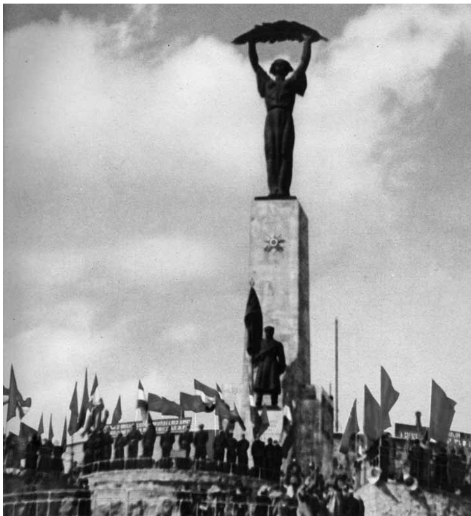
SZABADSÁG-SZOBOR: AZ ÚJ MAGYARORSZÁG JELKÉPE

Az MDP válasza természetesen nem csupán az erőszak, és főleg nem az erőszak. Az MDP előtérbe helyezi az emberek ne-